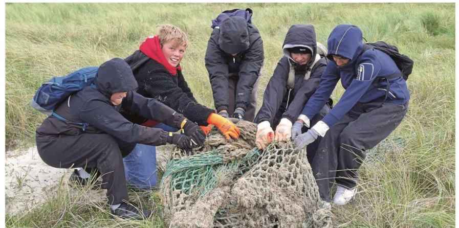
Das ist echte Teamarbeit: Nur mit gemeinsamer Kraft lassen sich alte Fischernetze aus dem Dünensand lösen.

T erminlich bedingt eine Woche nach dem offiziellen internationalen Coastal-Clean-up Day, dem größten „Küstenputz“ der Welt, beteiligte sich die KGS Norderney auch in diesem Jahr an der globalen Reinigungsaktion. Bereits seit 2002 führt die Kreisgruppe Norderney des BUND mit den Schülerinnen und Schülern der Kooperativen Gesamtschule Strandreinigungen im Osten der Insel durch. Vom Wrack aus reinigten die 35 Teilnehmer des 7. Jahrgangs inklusive Lehrkräften unter Anleitung der Mitglieder der Norderneyer Kreisgruppe des BUND und der Nationalpark-Rangerin bis zur Möwendüne den Strand und die Dünen.