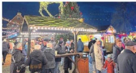
Die Nörder Wiehnacht ist am Freitagabend offiziell eröffnet worden.

NORDEN – Schon seit Montag locken einige Buden der Nörder Wiehnacht mit Glühwein, Leckereien und weihnachtlicher Stimmung – seit Freitagabend ist der Markt offiziell eröffnet. Bürgermeister Florian Eiben (SPD) gab mit dem traditionellen Einschalten des großen Weihnachtsbaums den Startschuss für eine Vorweihnachtszeit voller Lichterglanz, festlicher Musik und