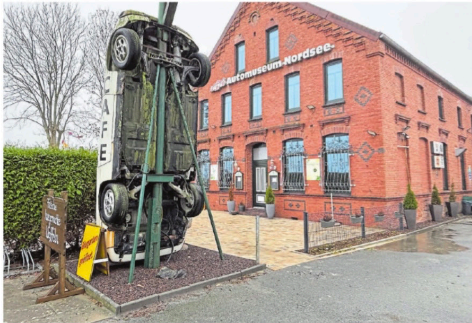
Das Norder Automobil- und Spielzeugmuseum an der Ostermarscher Straße – Ausgangspunkt für eine Zeitreise durch über 100 Jahre Automobilgeschichte.

Auf dem Erfolg ausruhen – das kommt aber nicht infrage. Im Gegenteil: Ingo Janssen und das Team haben hier noch viel vor. Ein großer Traum ist das American Diner, das direkt an das Museumsgebäude angebaut werden soll – und dieser rückt nun ein deutliches Stück näher. „Auf unsere Bauvoranfrage haben wir schon eine Genehmigung erhalten“, sagt Janssen. Sobald die endgültige Baugenehmigung vorliegt, soll es losgehen. An den vorderen Teil des alten Gulfhofs, in dem das Museum untergebracht ist, wird ein 18 mal 25 Meter großer Anbau entstehen. „Alles wird dann im 50er-Jahre-Stil sein. Die Möbel haben wir sogar schon“, verrät der Museumsleiter.