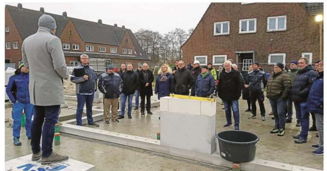
Handwerkerschaft und Politik waren Gäste der traditionellen Zeremonie im Mühlenquartier.

aus einem Fördertopf eines KfW-Programms für klimafreundliche Neubau-Wohngebäude. Hilfreich für den