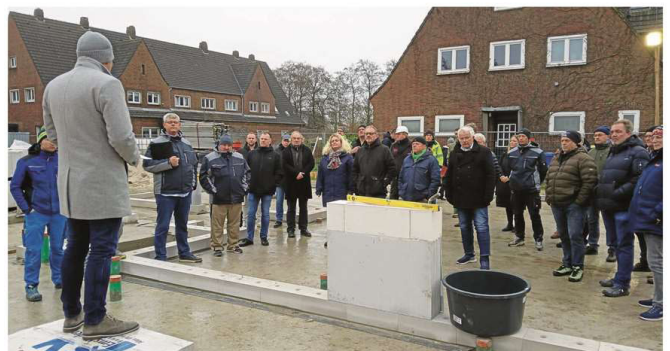
Handwerkschiffahrt und Politik waren Gäste der traditionellen Zeremonie im Mühlenquartier.

Die Idee der Stadt, ein eigenes Personalwohnhaus zu errichten, ist keineswegs neu, sondern schon vor Jahren entstanden. Ziel war es, einen verlässlichen städtepolitischen Wohnungspool aufzubauen, der es neuen Mitarbeitern erleichtert, auf der Insel einen guten Start zu haben. Da ist der Erwerb des Grundstücks in der Mitte des Mühlenquartiers im vergangenen Januar zu einem Preis deutlich unter dem insularen Bodenrichtwert mehr als nur ein Wegbereiter gewesen. Die voraussichtlichen Gesamtkosten belaufen sich auf rund 5,7 Millionen Euro, darunter sind auch gut 400.000 Euro