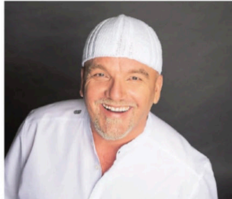
Kommt zur Sommertime nach Norderney: DJ Otzi.

Im Anschluss an das Konzert von DJ Otzi setzt der Abend laut Veranstalter nahtlos fort. Mit einer Sommertime-Party soll der Abschluss