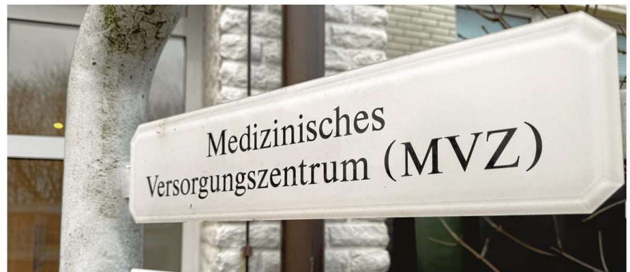
Die neu gegründete MVZ Norderney Gesellschaft wurde ins Handelsregister eingetragen.

Übergangsweise übernimmt der Bürgermeister selbst die Geschäftsführung des MVZ. Diese Lösung müsse jedoch nicht dauerhaft bestehen bleiben, wie Ulrichs erklärte. Die Stadt habe sich – analog zu ihren anderen Gesellschaften – bewusst für ei-