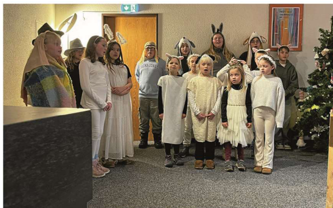
Auftritt des Kinder- und Jugendchores begeistert Senioren.

Die Senioren konnten sich schon einmal an dem Krippenspiel erfreuen, das Heiligabend um 15 Uhr im Familiengottesdienst aufgeführt wird. In ihm spüren Ochs und Esel im Stall schon sehr früh, dass bald etwas Besonderes passieren würde. Dem Esel jucken die Ohren und der Ochs hat so ein eigentüm-