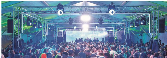
Für ein volles Haus auch im Partyzelt soll das hochkarätige DJ-Line-up sorgen.

Den Auftakt bei den Abendpartys im Festivalzelt macht