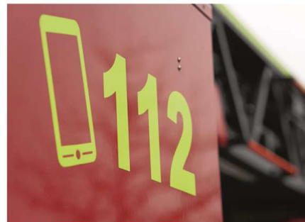
Die Inselfeuerwehr musste einmal mehr verstärkt wegen ausgelöster Brandmeldeanlagen ausrücken.

Trotz aller Einsätze für die Freiwillige Feuerwehr Norderney sind Brandmeldean-