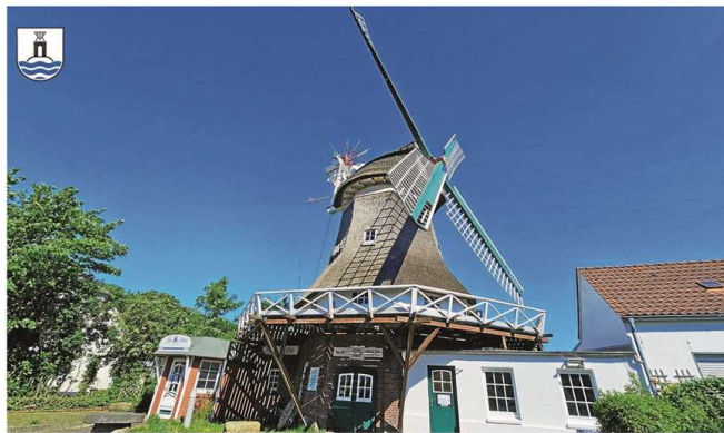
Noch immer wird ein Pächter für das historische Gebäude gesucht.

Eine Ausschreibung dazu findet man auf den Internetseiten der Stadt Norderney ( www.stadt-norderney.de ). Die Frist zu dieser Ausschreibung wurde um einen Monat verlängert und endet nun am letzten Tag des Jahres. In der Ausschreibung kann man erfahren, dass zuerst ein Umbau des historischen Gebäudes ab Oktober angedacht ist. Die Bau- und Sanierungsarbeiten der Mühle sind bereits in Planung und sollen voraussichtlich bis Ende 2026 abgeschlossen sein. Ziel ist es, die Mühle als ganzjährigen Gastronomiebetrieb zu etablieren – ein attraktiver Ort für die Norderneyer und Gäste,