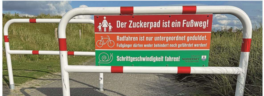
So wie in der jüngeren Vergangenheit soll es auch in Zukunft auf dem Zuckerpad zugehen, wenn es nach dem Willen der Kommunalpolitik geht.

Aufgrund ständig zunehmenden Radverkehrs und der schmalen Wegbreite war der Weg temporär für Biker gesperrt worden. Allzu oft wurde das Verkehrsverbot aber von den Pedalrittern missachtet. Eine angelegte Wegeverbreiterung kam aus Naturschutzrechtlicher Sicht nicht infrage. So bediente man sich vor drei Jahren eines Planungsbüros, um nach Alternativen Ausschau zu halten. Aber keine der Vorschläge fand letztendlich die Zustimmung der Politik auf der Insel, weil es zu weitergehenden Einschränkungen bei anderen Wanderwegen gekommen wäre. All dies mündete letztendlich in einen einjährigen Feldversuch. Seit September vergangenen Jahres ist der Zuckerpad wieder für den Radverkehr freigegeben. Dafür wurden verschiedene Maßnahmen wie die Neuaufstellung von Hinweisschildern,