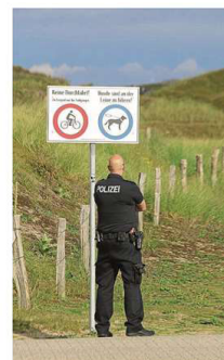
Kontrollen wie noch 2021 sind unerwünscht.

Eine dauerhafte Kontrolle des Wiederausschlusses des Radverkehrs wäre nur mit erheblichem Personalaufwand möglich und würde das Problem nicht nach-