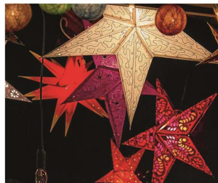
Weihnachtliche Handwerkskunst im To Huus.

NORDERNEY Der große Weihnachtsmarkt im Seniorenzentrum To Huus in der Mühlenstraße 4 beginnt heute um 14 Uhr und bietet im Haus einen Basar mit zahlreichen Ständen, an denen es alles gibt, was mit der Weihnachtszeit zu tun hat und noch einiges mehr. Handwerkskunst und Selbstgemachtes ist dabei ebenso zu finden wie ein umfangreiches Angebot an Kulinarischem für jedermann. Das geht von der Norderneyer Brat- und Currywurst über hausgemachte Erbsensuppe oder frische Waffeln und Crêpes. Vom Heimatverein Norderney bekommt man originalen Ostfriesentee serviert oder wählt Kaffee und Kakao. Wer es etwas gehaltvoller mag, wechselt an der Huus Bar zu echtem Norderneyer Bier, Glühwein, Lumumba oder genießt einen von Bärbel's legendären Cocktails. Etwas Besonderes für handwerklich Interessierte gibt es dann im Garten des