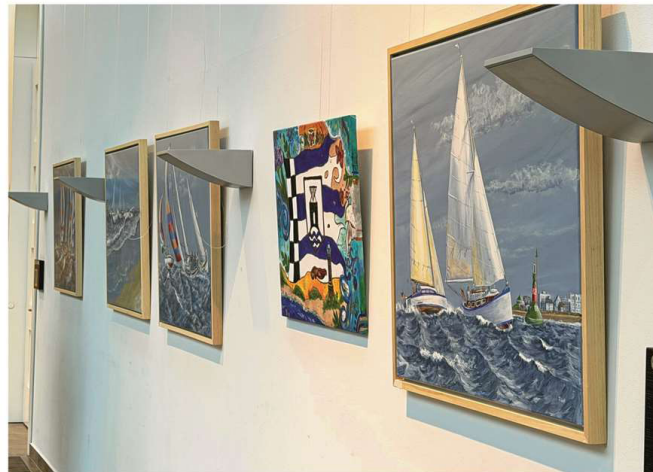
Unter dem Titel „Kunst um Nord“ zeigen vier Künstlerinnen aus Hamburg noch bis Anfang Ja- nuar ihre Werke im Conversationshaus.

11 Uhr Anlässlich des 150. Ge- burtstages des bedeutenden See- und Landschaftsmalers von Norderney, Poppe Folkerts (1875 bis 1949), von nationalem und internationalem Rang des