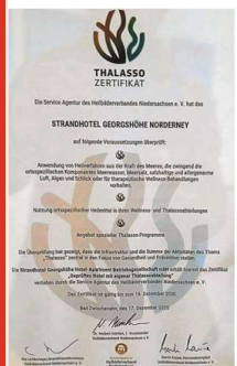
Urkunde des Heilbäderverbandes Niedersachsen.

Gut und gern 50 Prozent der Gäste nutzen die Thalassoangebote. Und das, dass auch so bleiben kann, dafür geben sich in der aktuellen Revisionsphase Handwerker aller Gewerke die Klinke in die Hand. Denn schon am 26. Dezember möchte die Georgshöhe wieder mit allem Service und Komfort seine Pforten öffnen.