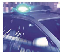
Polizei sucht Zeugen.

mer 15 stieß er mit dem Schild einer Werbefirma zusammen. Ohne sich um eine Schadensregulierung zu bemühen, flüchtete der Unbekannte. Für beide Vergehen nimmt die Polizei Norderney unter 04931 92980 Hinweise zum Unfallverursacher entgegen.