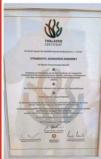
Urkunde des Heilbäderverbandes Niedersachsen.

Die Service-Agentur des Heilbäderverbandes Niedersachsen wurde im Auftrag des Landes Niedersachsen mit der Zertifizierung der Thalasso-Einrichtungen in Nordseeheilbädern betraut,