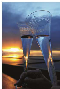
Ob Ruhe oder lieber Party: Auf Norderney hat man bis zum Jahresende die Wahl. Archivbild

Um 20 Uhr heißt es dann im Kurtheater „Musik & Comedy“ mit Bluenight Boogie im Kurtheater. Seit Jahren schon ist das Duo regelmäßig zum Jahreswechsel auf Norderney zu Gast und hat sich hier mit