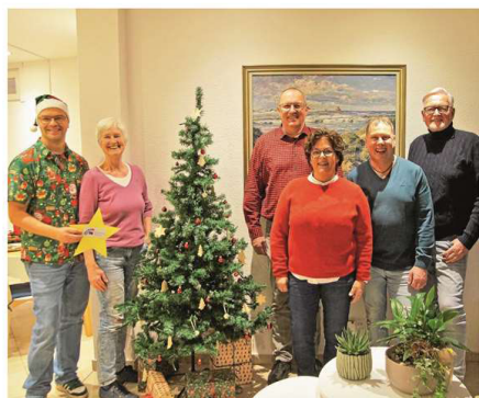
Spendenübergabe in der Orangerie.

Die Bürgerstiftung Norderney bedankte sich bei allen Gästen und Unterstützern des Stiftermahls. Nur durch deren Engagement sei es möglich, solche Veranstaltungen durchzuführen und die nachhaltige Förderung von Kindern und Jugendlichen auf der Insel sicherzustellen.