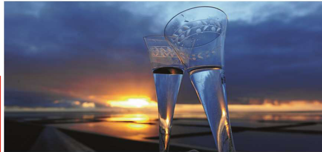
Ob in Ruhe oder lieber party-like: Auf Norderney hat man zum Jahresende die Wahl. Archivbild

Um 17 Uhr gastiert das Young Old Man Duo auf dem