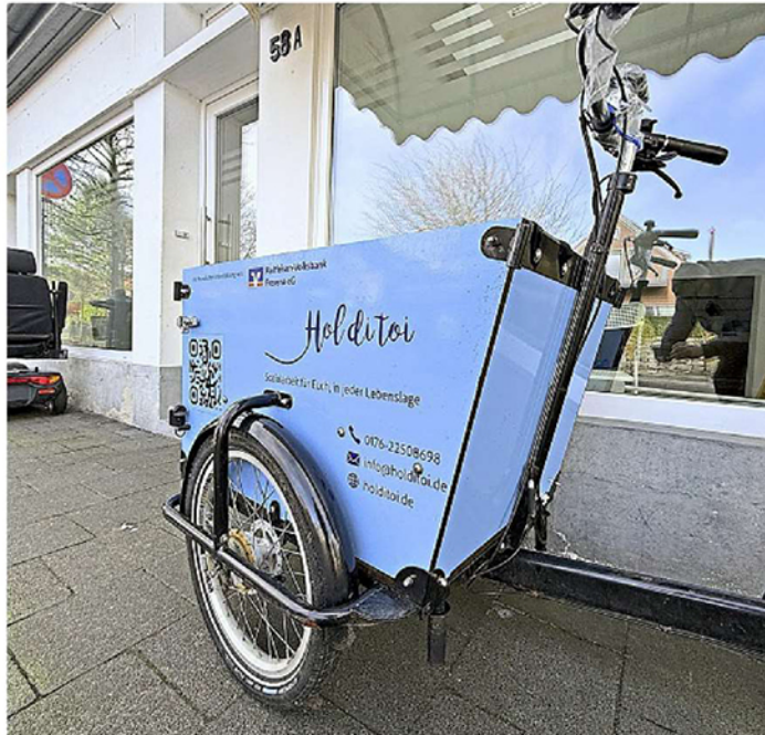
Seit 1. Januar organisiert der Sozialdienst Hol di Toi „Essen auf Rädern“ auf Norderney.