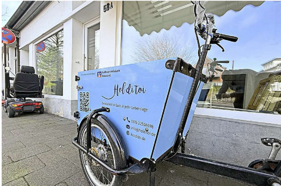
Seit 1. Januar organisiert der Sozialdienst Hol di Toi „Essen auf Rädern“ auf Norderney.