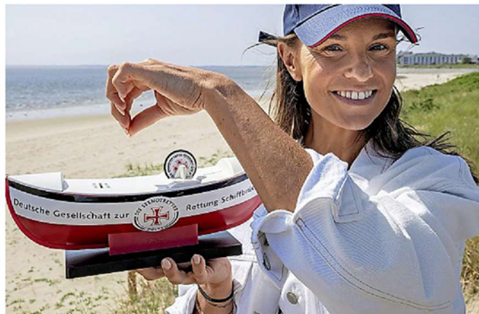
Seenotretter-Botschafterin Laura Wontorra mit einem Sammelschiffchen der Deutschen Gesellschaft zur Rettung Schiffbrüchiger (DGzRS)

Prominente Unterstützung haben die Seenotretter im abgelaufenen Jahr von ihrem Botschafter Klaus-Peter Wolf erhalten. Der Erfolgsautor und Erfinder der Ostfriesland-Krimis hat auf ungezählten Lesungen und Bühnenveranstaltungen für die DGzRS geworben.