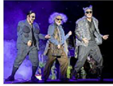
Eine Mischung aus Pop- und Rockklassikern zeigt „Ewig jung“.

Den Auftakt auf Norder-nei am Freitag, 6. Februar 2026, bildet die komödianti-sche Musiktheaterproduk-