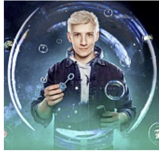
„Mellow“ präsentiert Magie mit reduzierten Mitteln aber großem Effekt.

2010 gewann er den Wettbewerb „Was uns antreibt“ und erhielt daraufhin erste Einblicke in die Showbranche, zum Beispiel ein Coaching in der Comedy Academy Köln und Treffen mit