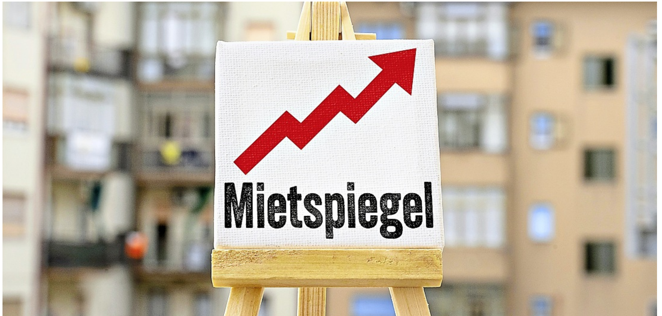
Die Mieten von Wohnungen auf Norderney stiegen in den vergangenen Jahren konstant leicht an.