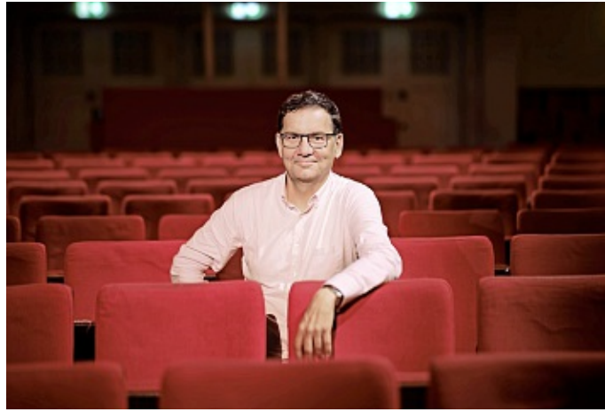
Ein Mix aus Parodie und Wortwitz erwartet die Zuschauer beim Abendprogramm mit Moritz Netenjakob.

Moritz Netenjakob zählt seit vielen Jahren zu den erfolgreichsten deutschen Comedy-Autoren und Bühnenkünstlern. Nach seinem Studium der Germanistik, Geschichte und Philosophie begann er seine Karriere als Au-