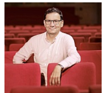
Ein Mix aus Parodie und Wortwitz erwartet die Zuschauer beim Abendprogramm mit Moritz Netenjakob.

Mit minimalen Mitteln erschafft er auf der Bühne eine Vielzahl an Figuren und Stimmen und wechselt mühelos zwischen ihnen. Seine präzisen Parodien, sein Gespür für Timing und seine Beobachtungsgabe machen ihn zu einem der vielseitigsten Entertainer der deutschen Comedy-Szene. Für die Augen: eine One-Man-Show. Für die Ohren: ein großes Ensemble. Die Veranstaltung wird für Besuchen- den ab zwölf Jahren empfohlen.