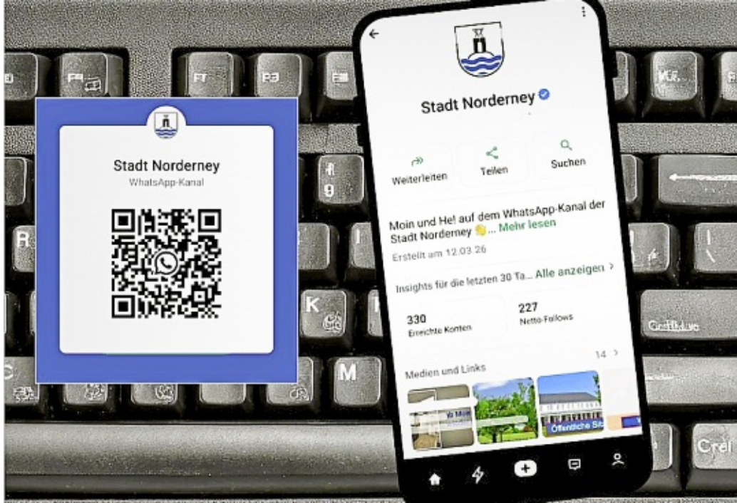
Alle wichtigen Informationen der Stadt und Warnungen kann man ab sofort per Whatsapp aufs Smartphone bekommen. Über den QR-Code lässt sich der Kanal abonnieren.

NORDERNEY Die Stadt Norderney hat jetzt einen offiziellen Behördenkanal auf Whatsapp. „So können wir eine große Zahl von Menschen erreichen, denn die App wird von Menschen jeden Alters genutzt und fast jeder hat sie auf dem Smartphone installiert“, sagt Norderneys Bürgermeister Frank Ulrichs. Nachrichten erscheinen direkt auf dem Sperrbildschirm der Abonnenten, wenn es so eingestellt ist. Die Nutzung ist einfach und kostenlos. Die Kanäle arbeiten als Einwegkommunikation: Abonnenten empfangen die Nachrichten chronologisch, ohne von Algorithmen beeinflusst zu werden.