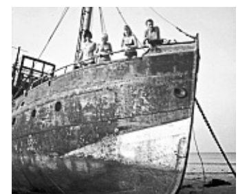
Diese Aufnahme der „Pionier“ stammt von September 1969.

Das Schicksal bewies eine ironische Note: Während der Heringslogger „Ministerialrat Streil“ Wochen später erfolgreich freigeschleppt werden konnte, blieb die „Pionier“ im Griff der Insel. Alle Versuche, den Bagger zu bergen, scheiterten.