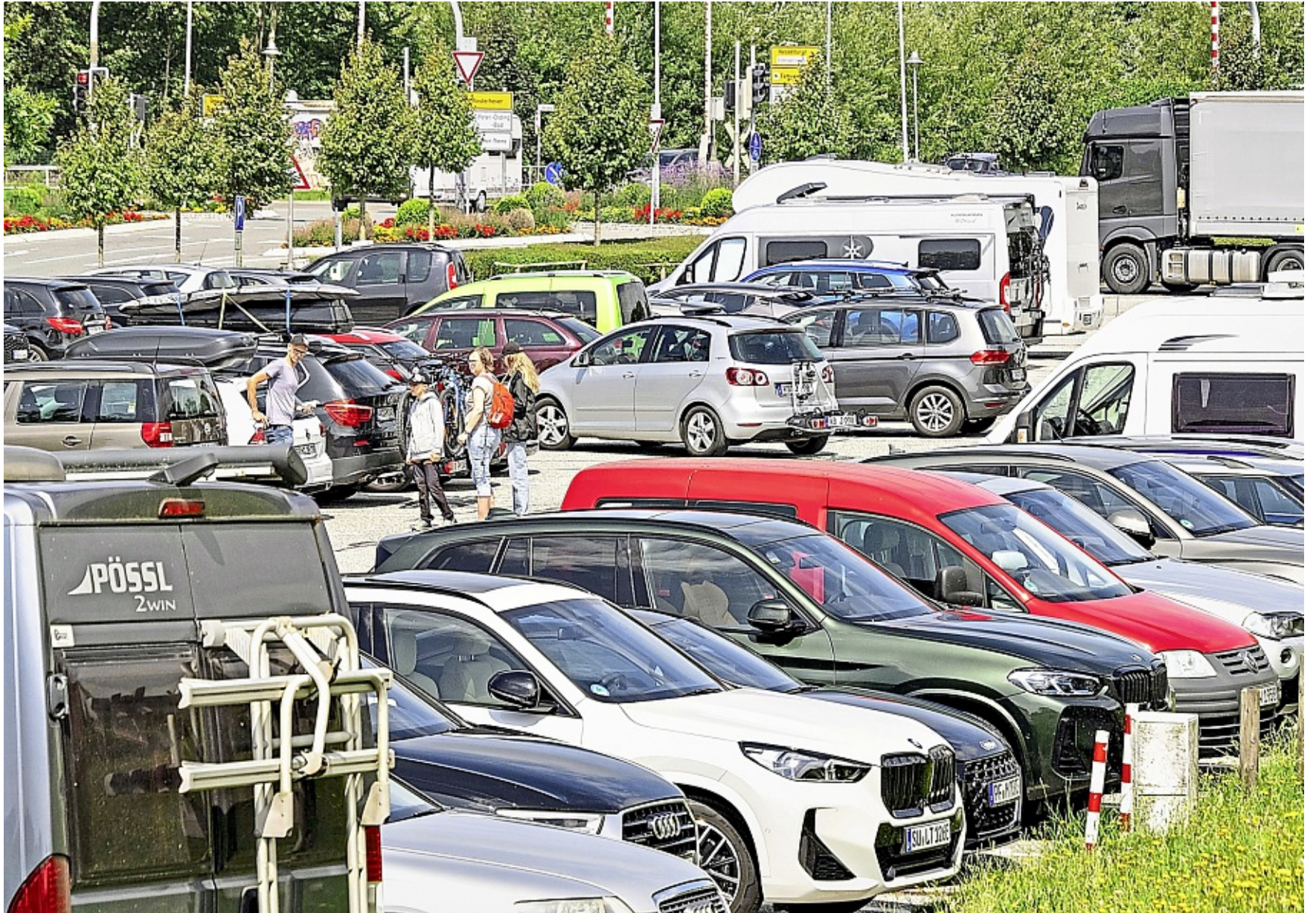
Der Preisvergleich beim Parken ist Teil des Verkehrskonzepts.