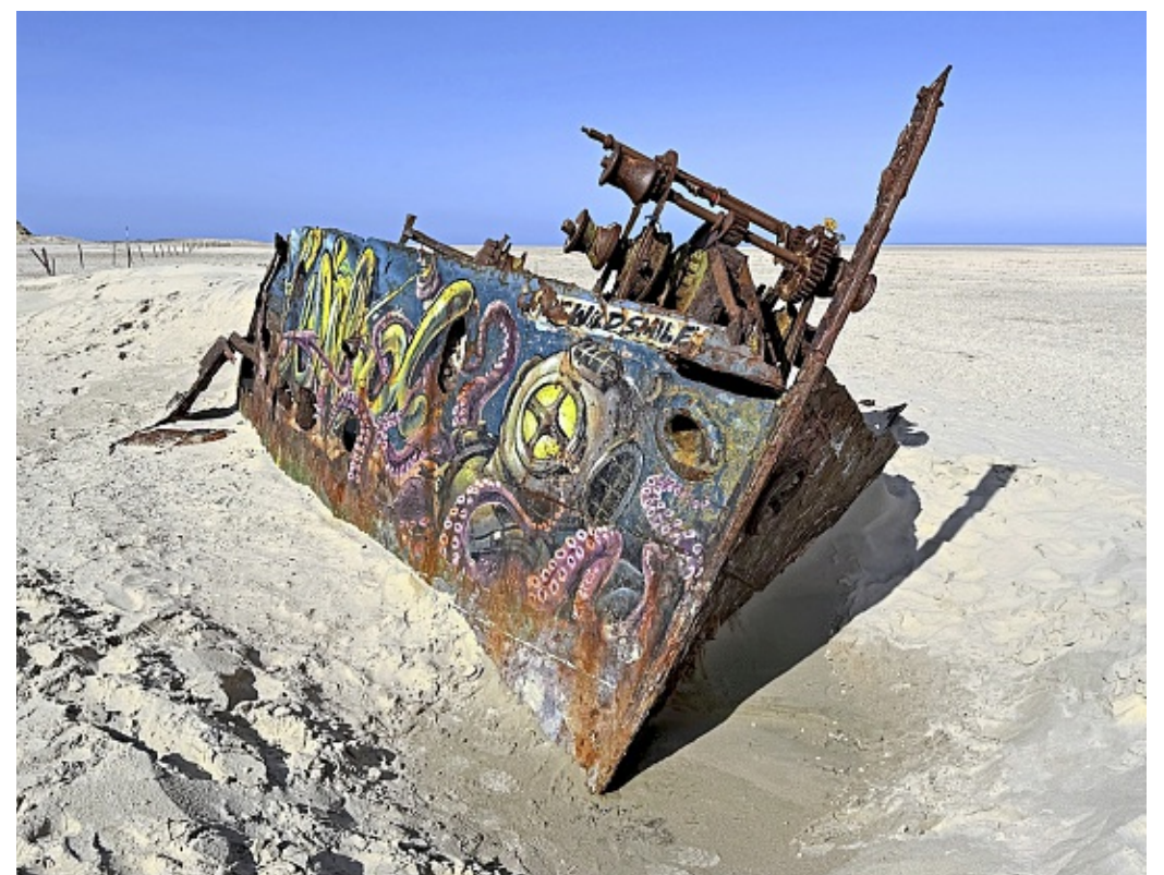
Da liegt es, das Wrack der „Pionier“ am Ostende von Norderney. Heute ist es ein beliebtes Fotomotiv.