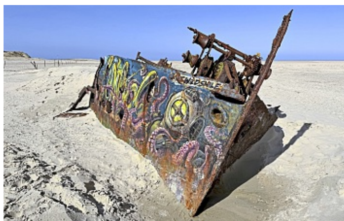
Da liegt es, das Wrack der „Pionier“ am Ostende von Norderney. Heute ist es ein beliebtes Fotomotiv.

Die Geschichte beginnt kurz vor Weihnachten, im Dezember 1967. In einer schweren Sturmnacht gerät der Heringslogger „Ministerialrat Streil“ auf dem Weg von Glückstadt nach Emden in Seenot. Auf der Othelloplate, einer tückischen Sandbank vor Norderney, läuft das Schiff auf Grund. Da das Norder-