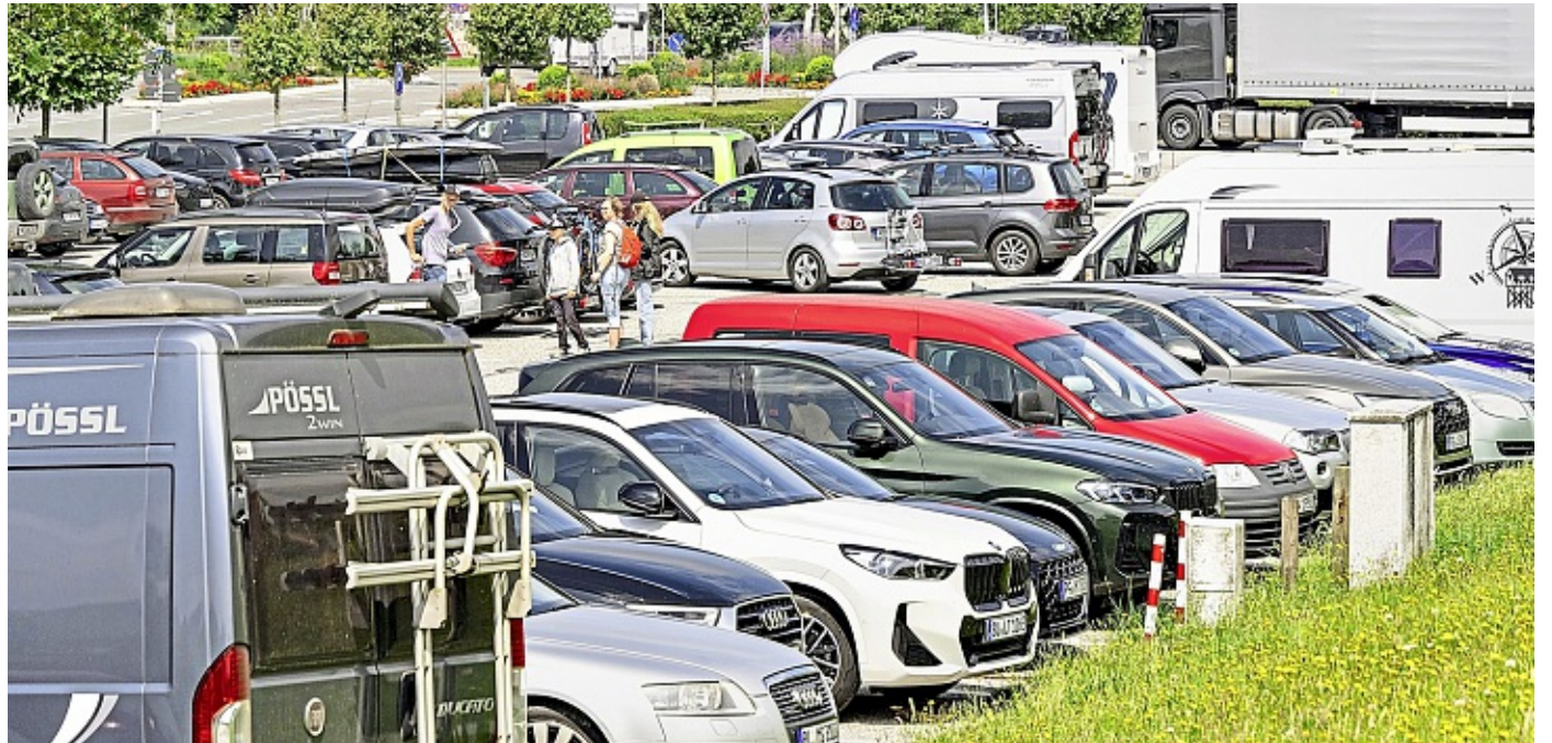
Der Preisangleich beim Parken ist Teil des Verkehrskonzepts.

Die neuen Preise fallen unterschiedlich aus: Auf dem Parkplatz C erhöht sich der Tagessatz von drei Euro auf 3,50 Euro, während auf dem Parkplatz B nun 6,50 Euro statt 5,50 Euro fällig werden. Beide Erhöhungen liegen damit leicht über den bisherigen Beträgen, bleiben aber unter deutlich drastischeren Varianten, die zwischenzeitlich politisch diskutiert worden waren. Der Kurzzeitparkplatz A