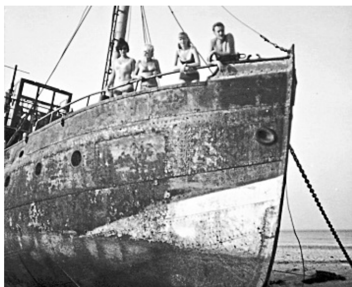
Diese Aufnahme der „Pionier“ stammt von September 1969.