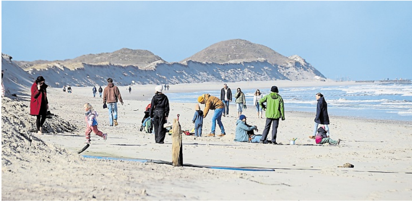
Auch eine bessere Auslastung in der Nebensaison ist Thema bei Tidentalk Nr. 35.