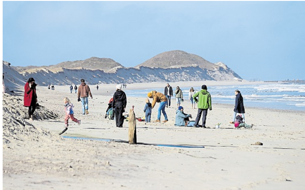
Auch eine bessere Auslastung in der Nebensaison ist Thema bei Tidentalk Nr. 35.

Dabei wird klar: Eine Insel ist ein empfindliches System. Jede Entscheidung hat Folgen, jede bauliche Veränderung muss sich in ein enges ökolo-