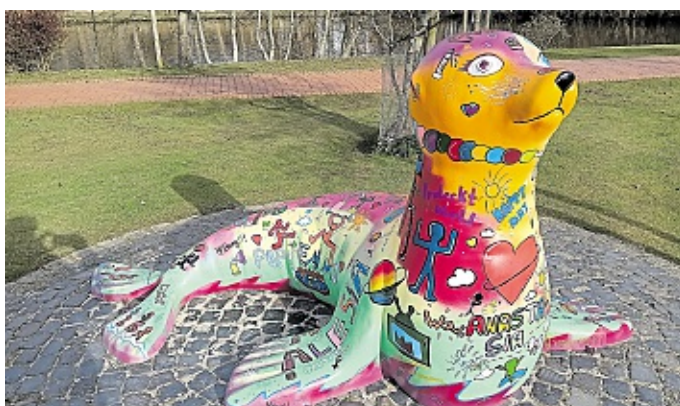
Im Rahmen von zwei Workshops konnten zwei Seehundskulpturen wieder frisch gestaltet werden.