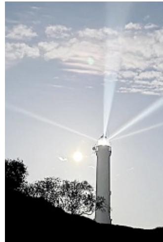
So wie ihn Gäste und Insulaner kennen: der Norderneyer Leuchtturm.

Auslöser der Störung ist ein technisches Problem im Antriebssystem des historischen Bauwerks. Wie Peter