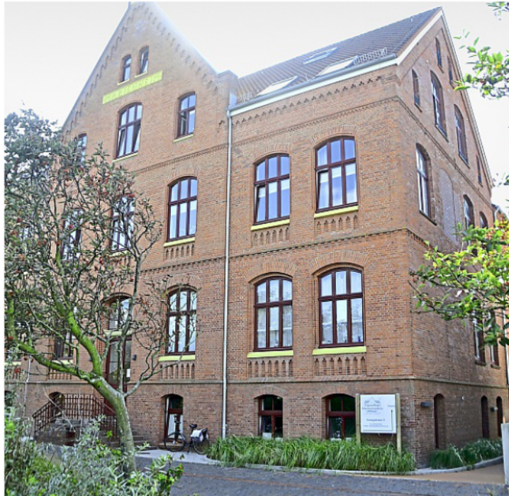
Die Marienresidenz auf Norderney: Ein Anteil am Gebäude wird versteigert.

Die Marienresidenz ist nicht nur historisch, son-