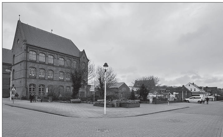
Der Verkehrsausschuss sieht Handlungsbedarf im Bereich der Grundschule.

(ape) – Die Verkehrssituation im Bereich der Grundschule hat den Ausschuss für Wirtschaft, Tourismus und Verkehr erneut beschäftigt. Ein ursprünglich angedachter Umbau zu einem verkehrsberuhigten Bereich stößt nach Einschätzung der Stadtverwaltung in Rücksprache mit den zuständigen Behörden auf erhebliche Hürden. Hintergrund ist ein Beschluss aus der vorherigen Sitzung, in dem eine Neuordnung des Verkehrsraums geprüft werden sollte. Die Verwaltung nahm dazu Kontakt mit Polizei und Straßenverkehrsbehörde auf und führte im Februar eine gemeinsame Begehung durch.