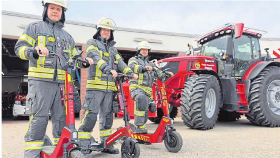
Die drei E-Scooter haben sich schon bei mehreren Einsätzen bewährt. Sie kamen schon bei Bränden und Personensuchen zum Einsatz.

Die Nordwest-Zeitung bietet ihren Leserinnen und Lesern ein umfassendes Informationsangebot von der kompletten ostfriesischen Halbinsel. Unsere Reporterinnen und Reporter haben dabei nicht nur das Geschehen in Norden, Aurich und Leer im Blick: Auf diesen Bereich legt die hier vorliegende NWZ-Ausgabe den klaren Schwerpunkt. Beachten Sie aber auch unsere Friesland-Ausgabe: Je-derzeit und zusätzlich kostenlos zu nutzen. ➔ https://ol.de/epaper-gm ➔ https://ol.de/epaper-ez ➔ https://ol.de/epaper-ah