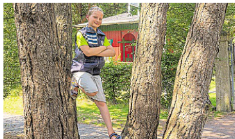
KIKU Fiete bringt frischen Wind in das Norderneyer Veranstaltungsprogramm.

Ein besonderes Naturerlebnis erwartet Kinder und Familien bei der Fledermauserkursion am 8. Mai um 20.45 Uhr im Kurpark.