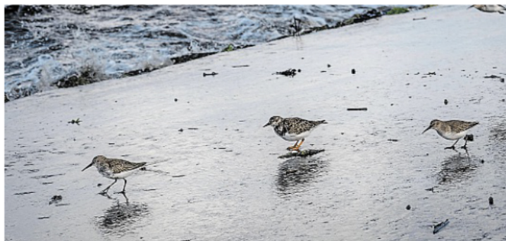
Auf der Insel Norderney leben über hundert verschiedene Vogelarten: Wie diese Steinwälzer, die am Strand nach Nahrung suchen.