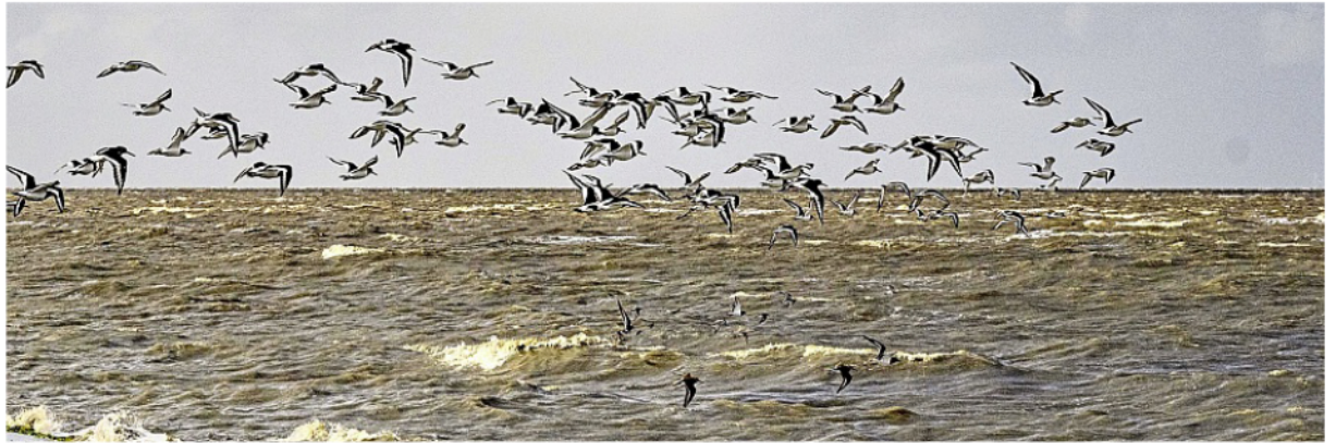
Über 300 Vogelarten leben, zumindest zeitweilig, im Nationalpark Wattenmeer.

Eine weitere vom Aussterben bedrohte Vogelart, die sich auf Norderney wohl-