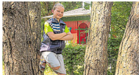
KIKU Fiete bringt frischen Wind in das Norderneyer Veranstaltungsprogramm.

Im Mai laden gleich zwei Kreativwerkstätten im Conversationshaus (Weißer Saal) zum Basteln ein: Am 6. Mai gestalten Kinder ab acht Jahren Muttertagsgeschenke, gefolgt von einer weiteren Werkstatt am 13. Mai, bei