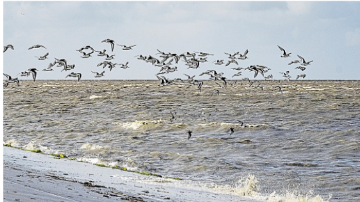
Über 300 Vogelarten leben, zumindest zeitweilig, im Nationalpark Wattenmeer.

Eine weitere vom Aussterben bedrohte Vogelart, die sich auf Norderney wohlfühlt, ist der Steinschmätzer. Wie der Sandregenpfeifer nutzt er die Kaninchenhöhlen in den Dünen. Steinschmätzer überwintern in Afrika und sind meist von April bis Oktober in Deutschland anzutreffen: dort, wo das Gelände offen