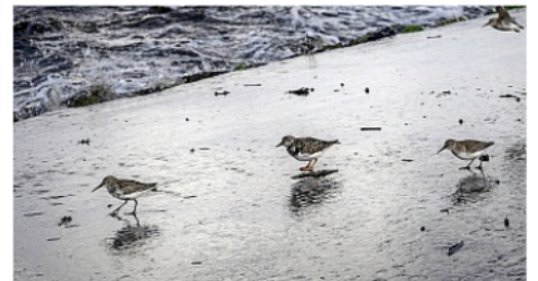
Auf der Insel Norderney leben über hundert verschiedene Vogelarten: So wie diese Steinwälzer, die am Strand nach Nahrung suchen.