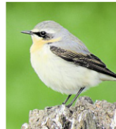
Ein Steinschmätzer: Oben grau, unten weiß, schwarze Federzeichnung.