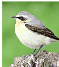
Ein Steinschmätzer: Oben grau, unten weiß, schwarze Federzeichnung.