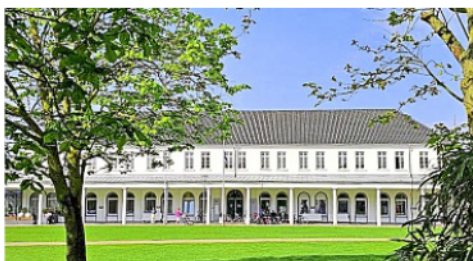
Spätestens bis zum 6. Juli müssen die Wahlvorschläge im Rathaus sein.