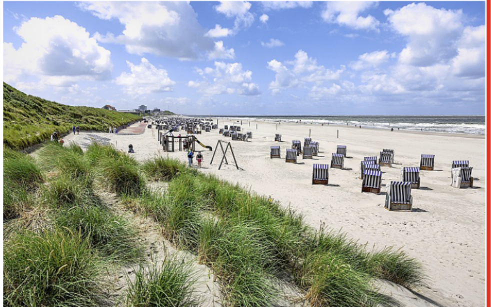
Am Norderneys Stränden lässt es sich im Allgemeinen gut aushalten – die Arbeiten für die Wasserstoffpipeline könnten jedoch für Beeinträchtigungen sorgen.

Die erforderlichen Genehmigungen für die Arbei-