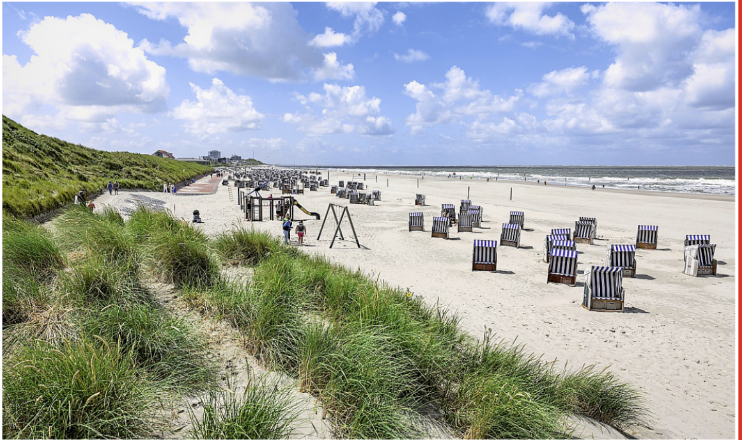
Am Norderneys Stränden lässt es sich im Allgemeinen gut aushalten – die Arbeiten für die Wasserstoffpipeline könnten jedoch für Beeinträchtigungen sorgen.