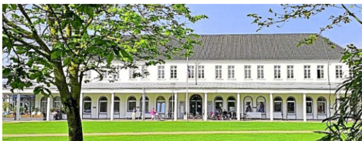
Spätestens bis zum 6. Juli müssen die Wahlvorschläge im Rathaus sein.