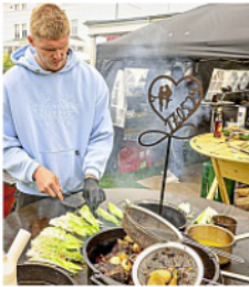
Der Landeswettbewerb fand auf dem Kurplatz statt.