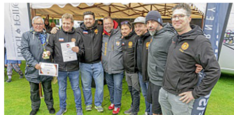
Das Team InTeam BBQ aus Quickborn sicherte sich auf Norderney den Landestitel.

dreigängiges Menü zubereiten. In diesem ersten Wettkampf setzte sich die Mannschaft der „Bling*Bling*BBQ“ Ladies durch und belegte den ersten Platz.