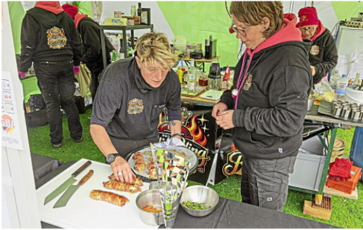
Bei der niedersächsischen Grillmeisterschaft auf Norderney landeten die „Bling*Bling*BBQ“ Ladies auf dem zweiten Platz.

Unter den Teilnehmern befanden sich Mannschaften aus dem vergangenen Jahr. Dazu gehörten die Vorjahressieger InTeam BBQ aus Quickborn sowie die Vizemeisterinnen des vergangenen Jahres, die „Bling*Bling*BBQ“ Ladies. Die deutsch-schweizerische Frauenmannschaft hatte im Vorjahr die Quali-