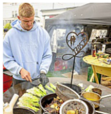
Der Landeswettbewerb fand auf dem Kurplatz statt.