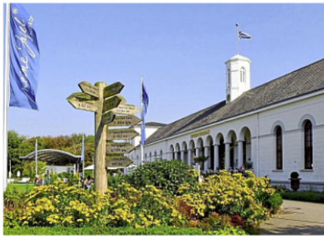
Das Conversationshaus ist Treffpunkt der Energieminister und vom 19. bis 22. Mai geschlossen.