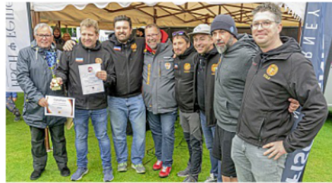
Das Team InTeam BBQ aus Quickborn sicherte sich auf Norderney den Landessieg.

fikation für die Deutsche Grillmeisterschaft in Ferropolis erreicht und dort den achten Platz belegt.