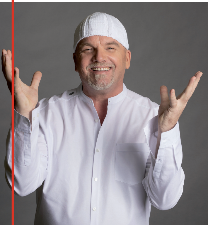
DJ Ötzi

Du bist bekannt für echte Partyhits und Mitsingklassiker. Wie bereitest du dich drauf vor, am Nordstrand von Norderney, so viele Menschen gleichzeitig in Festivalstimmung zu bringen?