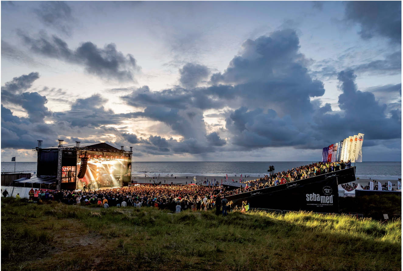
Summertime-Arena am Nordstrand von Norderney.