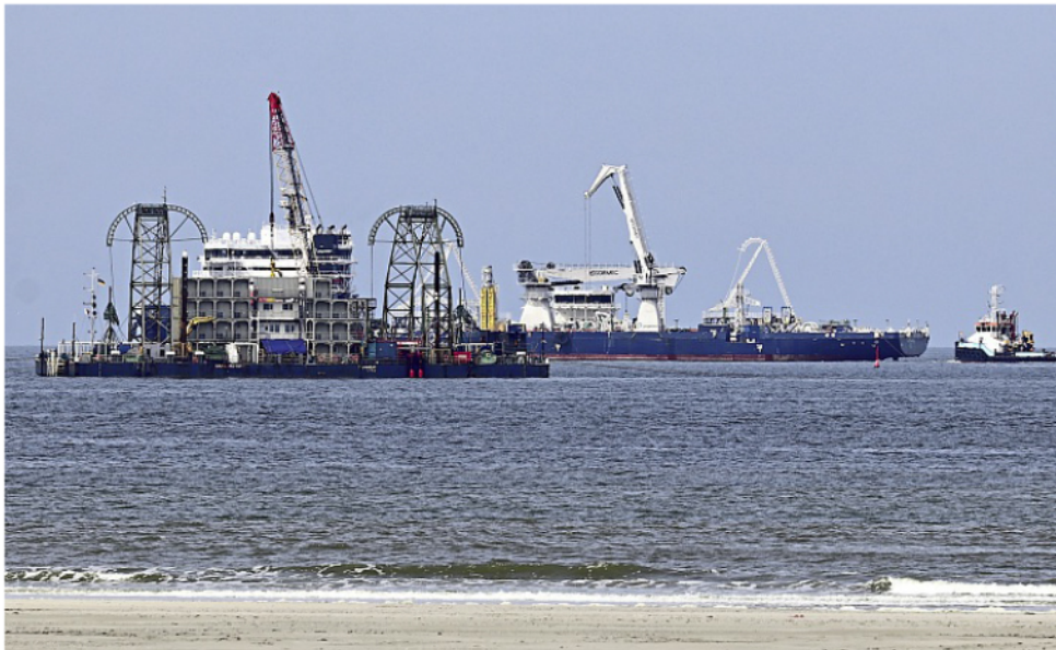
Der Kabelleger „Prysmian Marco Polo“ liefert im Hintergrund das Seekabel an, das mithilfe der „Barbarossa I“ verteilt wird.

Auch der Bereich der ausgelegten Kabel wird zeitweise abgesperrt. Nachdem die Kabel mit Seilwinden von der Inselmitte in die vorinstallierten Kabelschutzrohre eingezogen