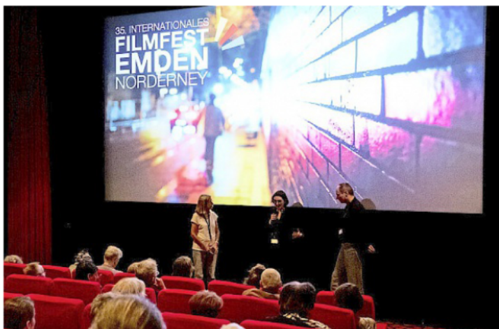
Das 36. Filmfest Emden/Norderney startet mit der Welturaufführung von „Sommer auf Asphalt“ am 3. Juni.

NORDERNEY Das Internationale Filmfest Emden-Norderney geht in die 36. Runde und präsentiert sich zum 27. Mal als renommierte Bühne für europäische Spiel-, Dokumentar- und Kurzfilme. Vom 3. bis 10. Juni 2026 erwartet die Besucher auf Norderney ein Programm mit sorgfältig ausgewählten Filmen für Jung und Alt sowie ein spannendes, unterhaltsames Rahmenprogramm. Der Ticketvorverkauf für das diesjährige Filmfest ist gestartet und die Karten sind bargeldlos innerhalb der Öffnungszeiten vor Ort an der Touristinformation im Conversationshaus, im Inselkino im Kurtheater sowie online auf www.norderney.de oder über die App „Norderney mein Inselassistent“ erhältlich. Einen Tag vor dem offi-