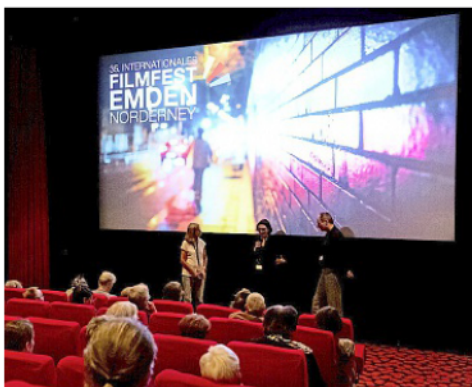
Das 36. Filmfest Emden/Norderney startet mit der Welturaufführung von „Sommer auf Asphalt“ am 3. Juni.

NORDERNEY Das Internationale Filmfest Emden-Norderney geht in die 36. Runde und präsentiert sich zum 27. Mal als renommierte Bühne für europäische Spiel-, Dokumentar- und Kurzfilme. Vom 3. bis 10. Juni 2026 erwartet die Besucher auf Norderney ein Programm mit sorgfältig ausgewählten Filmen für Jung und Alt sowie ein spannendes, unterhaltsames Rahmenprogramm. Der Ticketvorverkauf für das diesjährige Filmfest ist gestartet und die Karten sind bargeldlos innerhalb der Öffnungszeiten vor Ort an der Touristinformation im Conversationshaus, im Inselkino im Kurtheater sowie online auf www.norderney.de oder über die App „Norderney mein Inselassistent“ erhältlich.