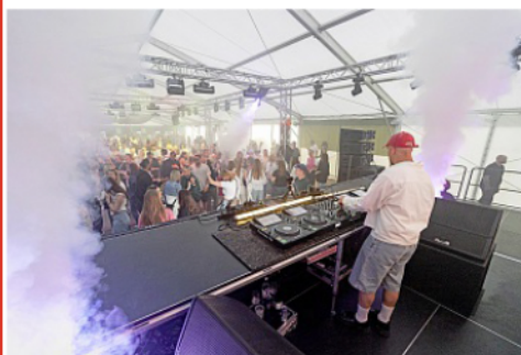
Auch Partys standen beim White Sands Festival auf Norderney hoch im Kurs.

Viel Zeit zum Ausruhen bleibt ohnehin nicht: Nach dem White Sands steht Ende Juli bereits das Summer-time-Festival an. Zudem organisiert die Agentur den Insellauf sowie das Triathlon-Event „Islandman Norderney“, das 2026 nach sechs Jahren Pause sein lang ersehntes Comeback feiert.