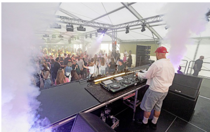
Auch Partys standen beim White Sands Festival auf Norderney hoch im Kurs.

Viel Zeit zum Ausruhen bleibt ohnehin nicht: Nach dem White Sands steht Ende Juli bereits das Summer-time-Festival an. Zudem organisiert die Agentur den Insellauf sowie das Triathlon-Event „Islandman Norderney“, das 2026 nach sechs Jahren Pause sein lang ersehntes Comeback feiert.