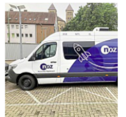
Im Luna-Mobil der noz gibt es auch praktische Hilfe beim Login zu den digitalen Produkten des Ostfriesischen Kuriers.

Neben Einblicken ist für Snacks und Erfrischungen gesorgt. Zudem wartet ein Glücksrad auf die Gäste, an dem mit etwas Glück ein iPad der 11. Generation gewonnen werden kann. Um die Führungen gut koordinieren zu können, wird um eine verbindliche und kostenfreie Anmeldung gebeten: noz.ticketcenter.de/norden-einblick/ . Das Team freut sich auf den persönlichen Austausch.