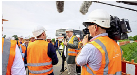
Das Medieninteresse am Besuch der Energieministerkonferenz auf der Amprion-Baustelle in Norden war groß.

hängigkeit und den Ersatz fossiler Brennstoffe.