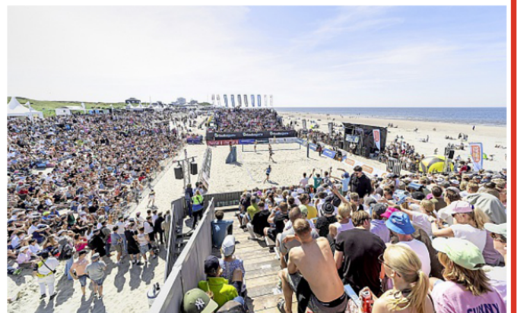
Tausende Zuschauer verfolgten die Spiele auf dem Main-Court.