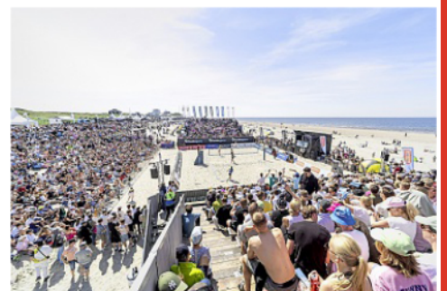
Tausende Zuschauer verfolgten die Spiele auf dem Main-Court.