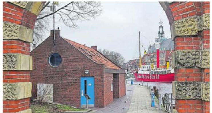
Die Toilette am Hafentor war zuletzt im Februar Thema, als unklar war, ob der Standort bleiben soll. Emden will das Netz öffentlicher Klos auffrischen.

Zuletzt hatte es im Februar Irritationen über das blaue Toilettenhäuschen am Hafentor gegeben, das wohl jeder Delftspaziergänger passiert: Dieses fehlte in jüngsten Zeichnungen für die Neukonzeptionierung des gesamten Areals, die mit dem aktuellen Umbau der Neutorstraße angedacht wurde. Laut Stadtbaurätin Irina Krantz sollte das zwar nicht heißen, dass dort künftig keine Keramik mehr zu finden sein wird – aber im jetzigen Zustand wird die Toilette dort wohl nicht bleiben. Auch dazu wird es kommende Woche sicherer Gewissheit geben.