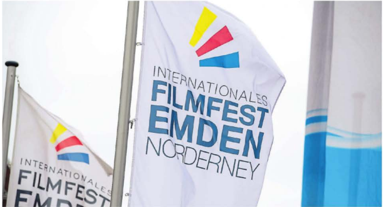
In diesem Jahr findet das 36. Internationale Filmfest Emden-Norderney statt.

Mit dabei ist in diesem Jahr auch der Schauspieler Florian Lukas, der bei der Preisverleihung am 7. Juni im Festspielhaus mit dem Emden Schauspielpreis ausgezeichnet wird.