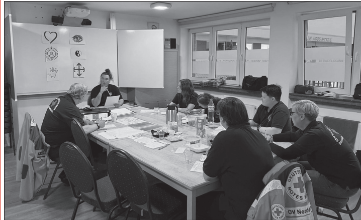
Situationen frühzeitig erkennen und Konflikte vermeiden – darum ging es in einem dreistündigen Präventionskurs.

(ape) – Wenn das Deutsche Rote Kreuz auf Norderney (DRK) bei Großveranstaltungen im Einsatz ist, geht es um schnelle Hilfe, medizinische Versorgung und Unterstützung vor Ort. Doch die Helfer erleben dabei nicht immer nur angenehme Situationen. Gerade bei größeren Veranstaltungen wie White-Sands und Summertime können sich Konflikte anbahnen, die sich weiter zuspitzen. Der DRK-Ortsverein setzt nun auf Prävention und führte am vergangenen Mittwoch eine Schulung für Deeskalation, Gewaltprävention und Notwehr durch.