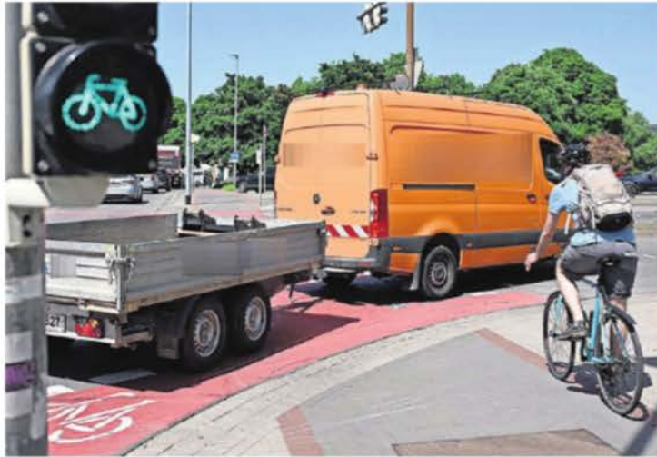
Achtung, Lebensgefahr: Radfahrer in Niedersachsen erleben immer wieder kritische Situationen im Straßenverkehr.

„Ein kurzer Moment der Unachtsamkeit kann schwerwiegende Folgen haben“, betonte er. Allein acht Radfahrer wurden demnach von abbiegenden Autos oder Lastwagen erfasst und getötet, neun wei-