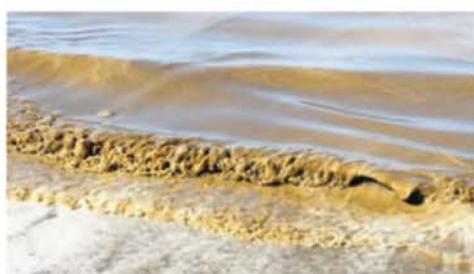
Unschön, aber nicht gefährlich: Braunalgen vor dem Strand von Norderney.

Obwohl sie auf Sonnenlicht angewiesen sind, um Photosynthese zu betreiben, sind Braunalgen keine Pflanzen. Sie haben keine Wurzeln, Blätter oder Stängel, um Nährstoffe zu transportieren. Stattdessen bezieht jede Zelle das, was sie braucht, direkt aus dem Meerwasser, so das Institut. Braunalgen haben sich vor mehr als einer Milliarde Jahren unabhängig von Tieren und Landpflanzen entwickelt. Ihr letzter gemeinsamer Vorfahr war ein Einzeller, was bedeutet, Tiere, Pflanzen und Braunalgen die Mehrzelligkeit eigenständig entwickelt hätten.