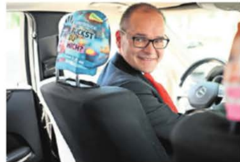
So wird's gemacht: Grant Hendrik Tonne (SPD), Niedersachsens Wirtschaftsminister, bei der Vorstellung der Kampagne zum Schulterblick.