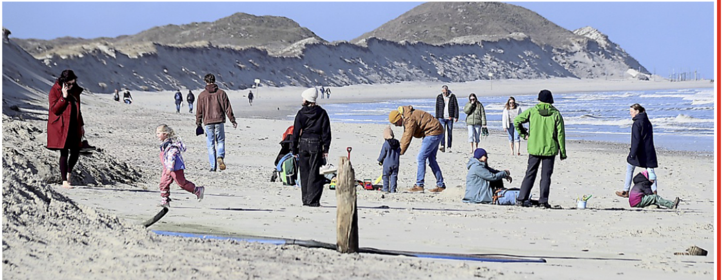
Viel Zeit bleibt Tagesgästen nicht: Ein Abstecher an den Strand und dann ins Café in die Stadt.