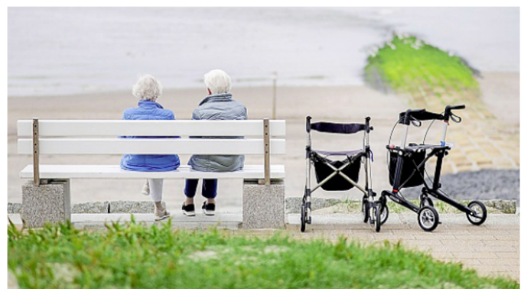
Besonders an sonnigen Tagen entscheiden sich viele spontan, nach Norderney zu fahren.

„Unser Ziel ist ein Norderney, das offen, gastfreundlich und wirtschaftlich stark bleibt. Dazu gehören Tagesgäste ausdrücklich dazu“, enden die Inselliberalen ihre Stellungnahme.