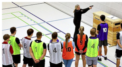
Der Sporttest der Polizei brachte auch die trainierten Schüler ins Schwitzen.

Bevor es sportlich wurde, gab es erst einmal Einblicke in den Alltag derjenigen, die diesen Beruf tatsächlich ausüben. Fünf Polizisten nahmen sich rund eine halbe