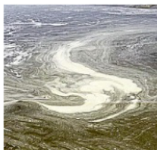
Für den Schaum und die brau- ne Wasserfärbung ist die „Al- genblüte“ verantwortlich.

Messungen der vergangen- en Woche zeigen zwischen 3000 und 4200 Kolonien pro