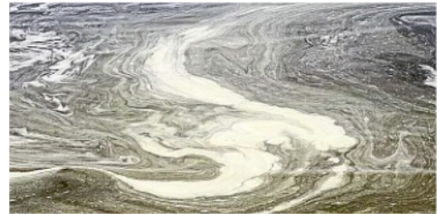
Für den Schaum und die braune Wasserfärbung ist die „Algenblüte“ verantwortlich.

und Nährstoffeinträge, die zu dieser Jahreszeit typisch sind. „Das ist ein natürlicher Prozess, den wir jedes Jahr beobachten“, betonen sowohl der NLWKN als auch Experten vor Ort. Für Badegäste besteht nach aktuellem Stand keine Gefahr. Braunalgen produzieren keine Toxine und gelten als harmlos. Sie tragen im Gegenteil erheblich zur Sauerstoffproduktion und zur CO 2 -Bindung im Meer bei. Unterwasserwälder aus Braun-, Rot- und Grünalgen gehören zu den artenreichsten Lebensräumen der Erde und spielen eine zentrale Rolle im marinen Ökosystem.