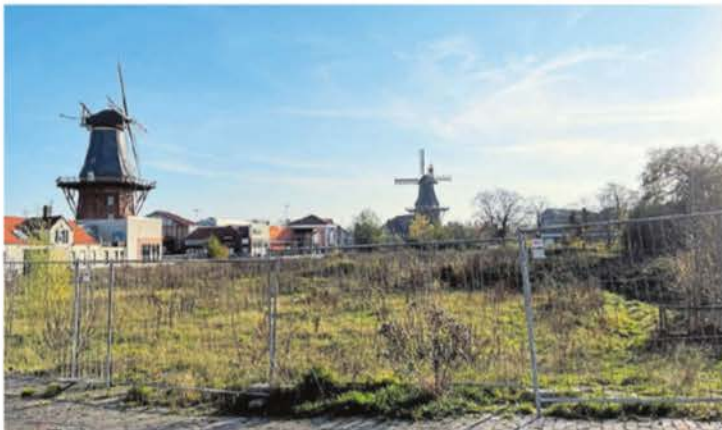
Hier soll das neue Baugebiet entstehen – das Norder Tor ist nur einen Katzensprung entfernt.

Bauherr des Projekts ist ein Auricher Unternehmer. Vermarktet wird die Anlage von der ID Bauträger GmbH, die inzwischen auch verstärkt im Internet für das Vorhaben wirbt. Auf Nachfrage der NWZ be-