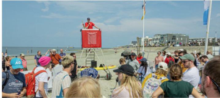
Sich mit den Filmschaffenden in die Fluten stürzen kann man nur beim Filmfest Emden/Norderney.

Mit seiner klaren Haltung und großen Dringlichkeit ist der Film ein kraftvolles Plädoyer für Gemeinschaft, Vielfalt und eine wehrhafte, pluralistische Demokratie – auf Norderney und weit darüber hinaus. Gezeigt wird der Streifen auf Norderney