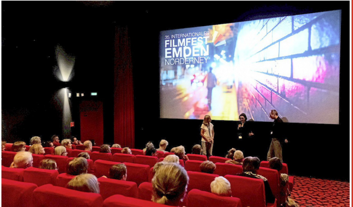
Am Mittwoch, 3. Juni, ist der offizielle Beginn des 36. Internationalen Filmfests Emden/Norderney.

Norderneyer Engel 2026 für „Staatschutz“ von Faraz Shariat: Mit dem Norderneyer Engel, dem Integrationspreis der Insel Nor-