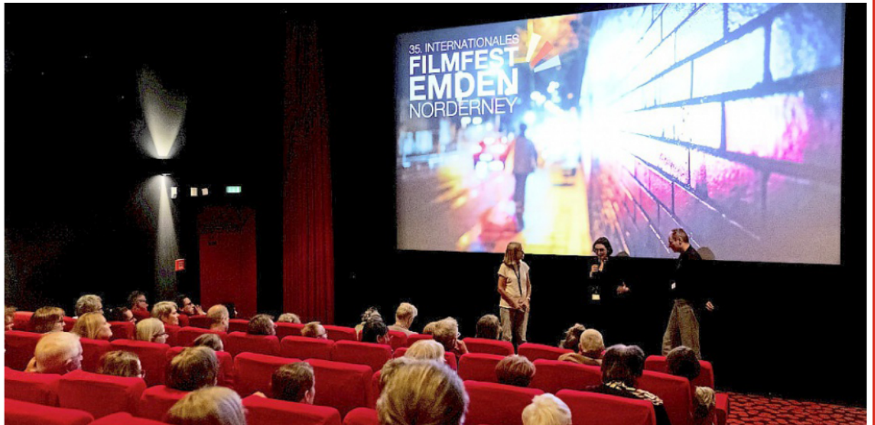
Am Mittwoch, 3. Juni, ist der offizielle Beginn des 36. Internationalen Filmfests Emden/Norderney.