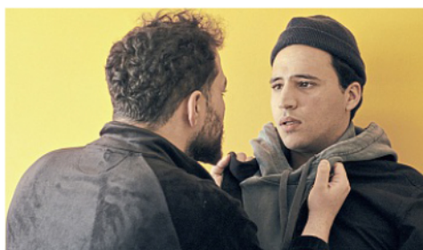
In „Gropiusstadt Supernova“ geht es um wichtige Lebensentscheidungen.

Einzeltickets gibt es online, 3-Filme-Tickets, 6-Filme-Tickets und Dauerkarten kann man nur im Conversationshaus an der Touristininformation und an der Kinokasse im Kurtheater erwerben.