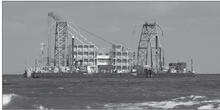
Die Verlegebarge „Barbarossa I“ fällt vorraussichtlich heute am Oase-Strand trocken.

Norderney – Der Übertragungsnetzbetreiber Amprion kommt mit der Seekabelverlegung für Stromtrasse Dol-Win-4 voran. Am heutigen Montag erreicht die Verlegebarge „Barbarossa I“ (siehe Bild) voraussichtlich den Oase-Strand und fällt nordöstlich der Strandsauna trocken. Wie das Unternehmen mitteilte, werden bei der Ankunft am Strand Ankerseile an die zuvor ausgebrachten Anker gespannt und der Bereich wird für einige Tage abgesperrt. Die Kabel werden anschließend von der Barbarossa I abgespult und in einer Schlaufe in westliche und südliche Richtung auf einer Länge von etwa 700 Metern auf dem Strand ausgelegt. Auch dieser Bereich wird zur Sicherheit zeitweise gesperrt werden. Anschließend werden die Kabel mit Seilwinden vom Strand zur Inselmitte in die vorinstallierten Kabelschutzrohre eingezogen. Insgesamt ist mit Einschränkungen im