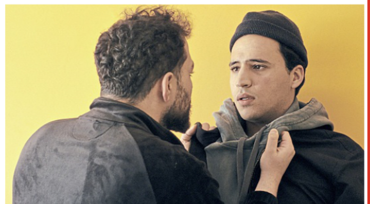
In „Gropiusstadt Supernova“ geht es um wichtige Lebensentscheidungen.