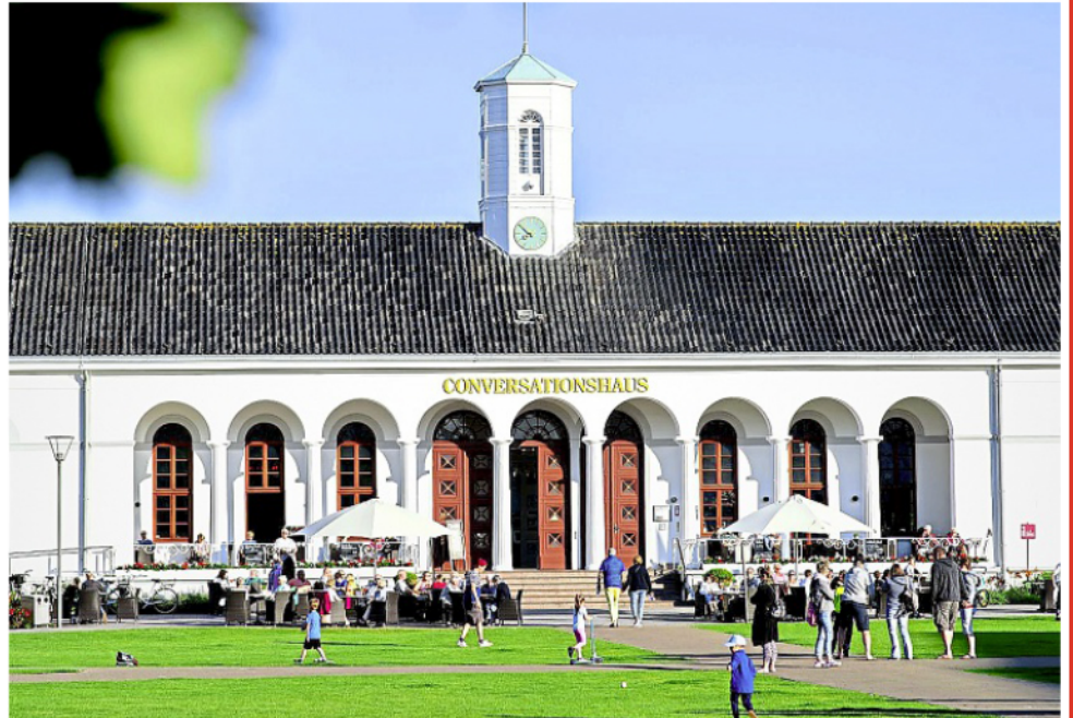
Der Kurplatz vor dem Conversationshaus auf Norderney wird während der Fußball-Weltmeisterschaft zur Public-Viewing-Arena. Nicht nur die Spiele der deutschen Elf sollen gezeigt werden.