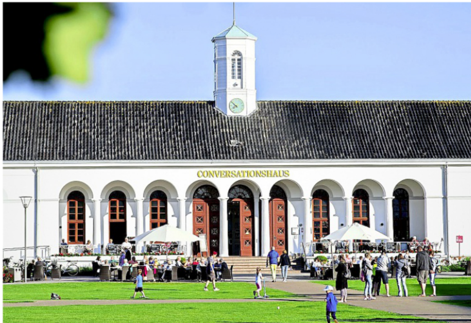
Der Kurplatz vor dem Conversationshaus auf Norderney wird während der Fußball-Weltmeisterschaft zur Public-Viewing-Arena. Nicht nur die Spiele der deutschen Elf sollen gezeigt werden.