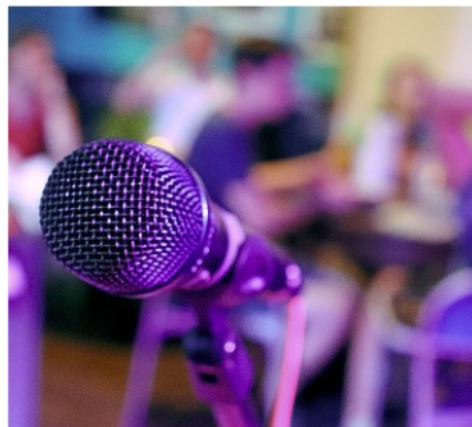
Ein Mikrofon, ein kleines Repertoire und etwas Mut ist alles, was man für die Open Stage Norderney braucht.

Das Format lebt von Überraschungen: Ein poetischer Text folgt auf eine Singer-Songwriter-Nummer, danach vielleicht Stand-up, Improtheater oder ein spontanes Duett zweier Men-