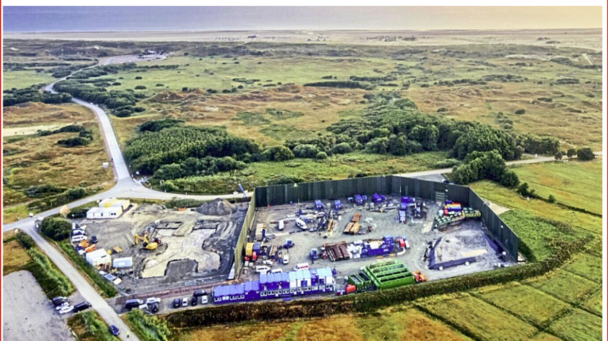
In der Inselmitte liegt das Herzstück der Offshore-Kabeltrasse. Hier ist die Start- und Zielfläche für die Bohrungen.