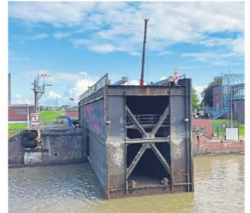
Wird jetzt im Schwimmdock gereinigt und gewartet: das Außenschleusentor der Großen Seeschleuse.

Der Torwechsel ist dann auch vor allem eine Geschick-