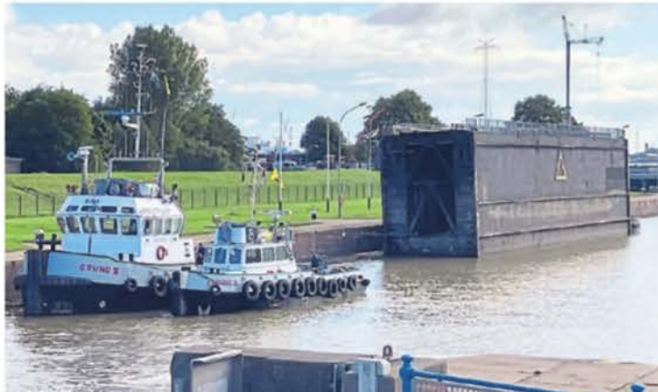
Warten auf das Schlepperballett: Die beiden Arbeitsschiffe bugsieren die Schleusentore an ihren neuen Platz.

Die Tore der Großen Seeschleuse werden regelmäßig ausgetauscht. Je nach Verfassung des einzelnen Schleusentores wird das alle ein bis anderthalb Jahre durchgeführt. Das bisherige Tor wird nun in das Trockendock der Hafengesellschaft auf dem