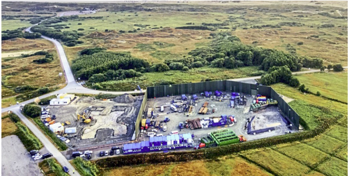
In der Inselmitte liegt das Herzstück der Offshore-Kabeltrasse. Hier ist die Start- und Zielfläche für die Bohrungen.

Die einzelnen Schritte der Aktionen wurden anhand von Grafiken dargestellt. Dazu gehörten auch Erklärungen über den Zusammenbau der Rohre und deren Lagerung am Weststrand, wo die einzelnen Rohrstücke zu 550 Meter langen Elementen zusammengefügt werden, bevor