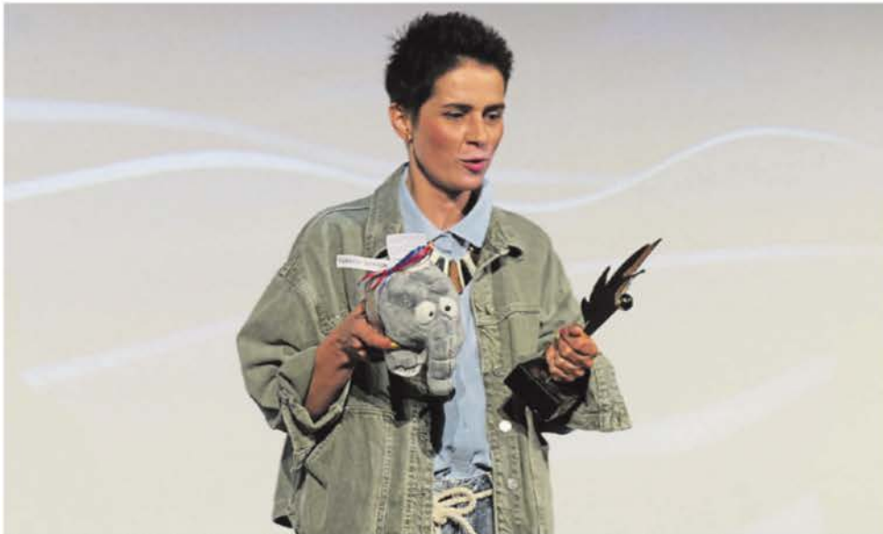
Fand den Weg aufs Emders Filmfest: Nora Tschirner war im Vorjahr mit dem Schauspielpreis ausgezeichnet worden. Den holt sie sich jetzt im Festspielhaus am Wall ab.

Nichtsdestotrotz passte das zu ihrem Auftreten: Denn Nora Tschirner ging gleich in die Offensive und animierte das Publikum Otto-Zitate zu ergänzen, was anfänglich aus ihrer Sicht nicht sonderlich