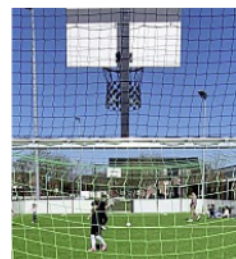
Hier kann nicht nur Fußball gespielt werden.