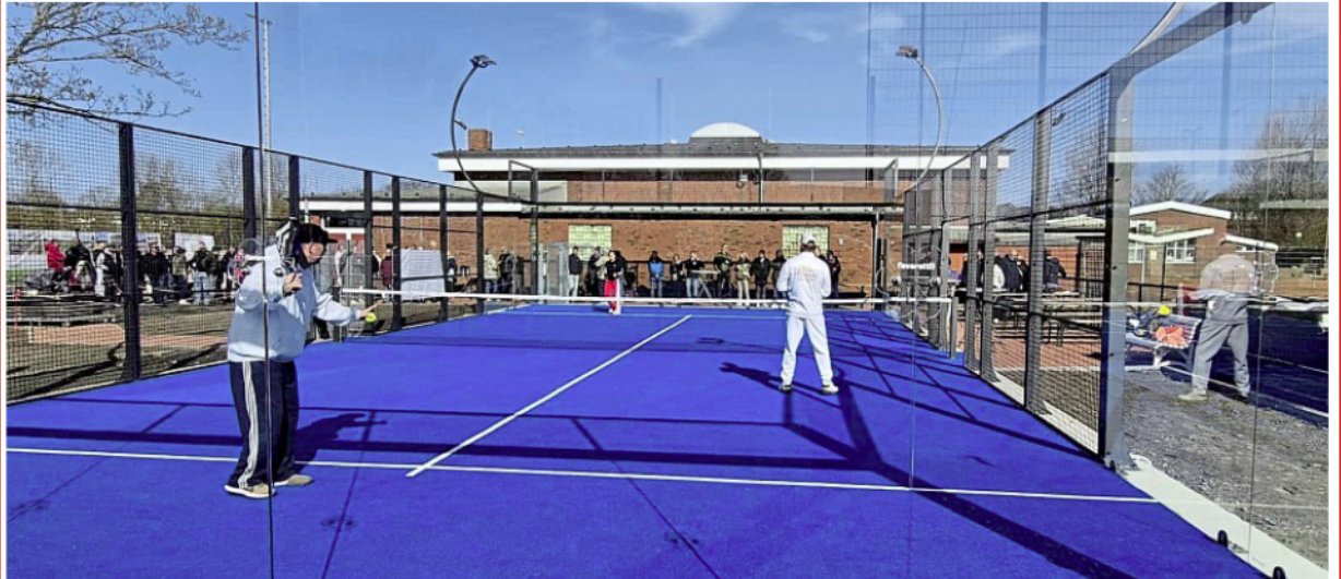
Die robuste Qualität des Padel-Courts erlaubt auch eine Nutzung in den Wintermonaten.