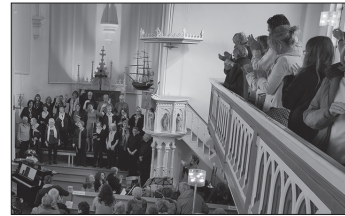
Stehenden Applaus zum Abschluss gab es beim letzten Konzert des Inselchores.

„Der Inselchor war mein Baby, jetzt ist es groß geworden und ich muss loslassen“, sagte die sichtlich gerührte Vorsitzende