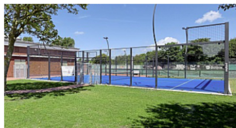
Mit den Flutlichtanlagen an beiden Courts kann man auch bei Dunkelheit spielen.

„Wir werden immer versuchen, uns weiterzuentwickeln und immer neue Sportarten anzubieten“, sagt Hahnen. Der Calisthenics-Park ist für das kommende Jahr geplant und soll das Angebot auf den Freiflächen ergänzen – ein weiterer Schritt, um die Sportanlagen der Stadt Norderney langfristig attraktiv und ganzjährig nutzbar zu machen.