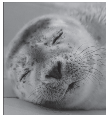
... und Bert.

Durch menschliche Störungen komme es vor, dass ein Jungtier nicht ausreichend gesäugt werden kann. Ihm fehle dann die Kraft, dem Muttertier zu folgen: „Also gerade jetzt gilt: Finger weg von den Wildtieren, Smartphone in der Tasche lassen und mal keine Fotos machen – Ruhe bewahren und Abstand halten. Sie helfen damit, Heuler zu vermeiden.“