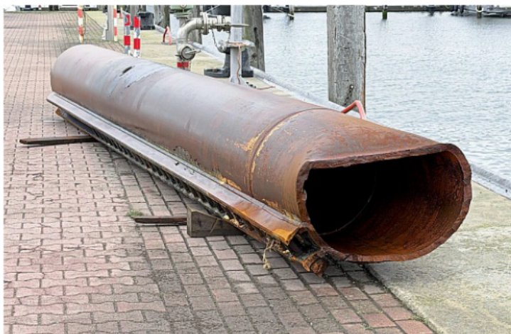
Eines der verbogenen Standbeine liegt derzeit im Norderneyer Innenhafen.

Die spezialisierte Flachwasser-Kabelbarke hatte aufgrund des ständigen Seeganges Probleme mit ihren Haltankern. Dadurch kam es dazu, dass die ausfahrbaren Standfüße, die eigentlich nur zur zusätzlichen Sicherung dienen, teils verbogen und somit nicht