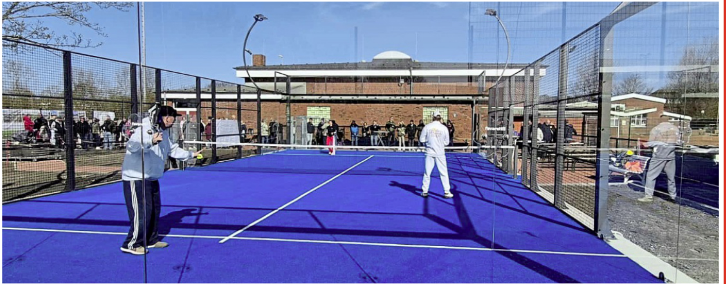
Die robuste Qualität des Padel-Courts erlaubt auch eine Nutzung in den Wintermonaten.