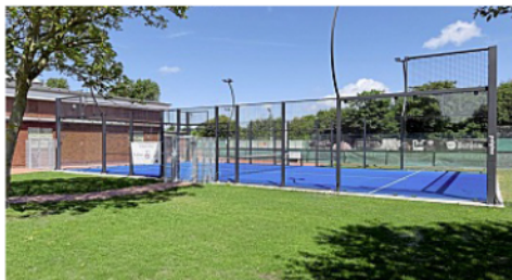
Mit den Flutlichtanlagen an beiden Courts kann man auch bei Dunkelheit spielen.