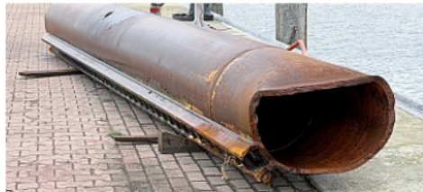
Eines der verbogenen Standbeine liegt derzeit im Norderneyer Innenhafen.

Die spezialisierte Flachwasser-Kabelbarke hatte aufgrund des ständigen Seeganges Probleme mit ihren Halt-ankern. Dadurch kam es dazu, dass die ausfahrbaren Standfüße, die eigentlich nur zur zusätzlichen Sicherung dienen, teils verbogen und somit nicht wieder ein-