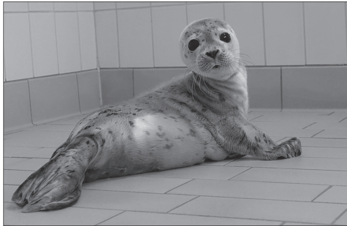
Werden in der Seehundstation Norddeich aufgepäppelt und auf ein Leben in Freiheit vorbereitet: die Seehundjungen Ernie ...

Die Geburtenphase der Seehunde und somit die Aufzuchtphase steht in der dritten Juniwoche vor ihrem Höhepunkt, so die Mitteilung der Seehundstation: „Jungtiere werden von den Muttertieren auf den Sandbänken gesäugt und während der Nahrungssuche kurzfristig abgelegt.“ Ein Jungtier am Strand bedeutet daher nicht zwangsläufig, dass es sich um einen Heuler handelt, der dauerhaft von seiner Mutter getrennt wurde. Gerade an den langen Wo-