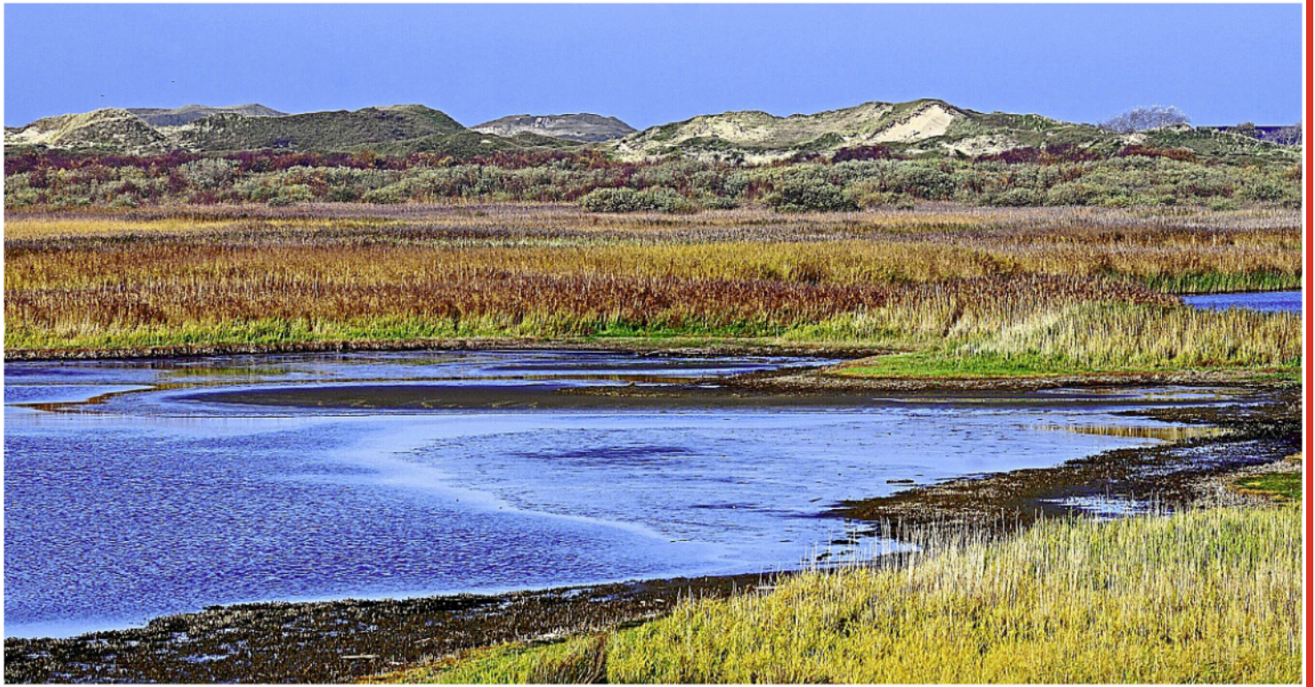
Aus ökologischer Sicht machen Salzwiesen sicherlich Sinn. Wie aber sieht es mit der Sturmflutsicherheit aus?