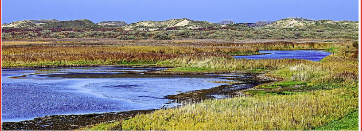
Aus ökologischer Sicht machen Salzwiesen sicherlich Sinn. Wie aber sieht es mit der Sturmflutsicherheit aus?