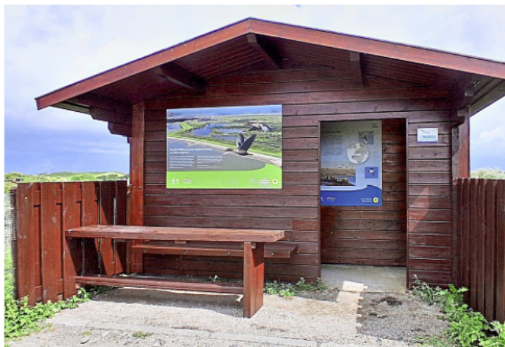
Komplett restauriert, ist die Beobachtungshütte am Südstrandpolder wieder nutzbar.

Das Bauwerk ist nicht nur bei Vogelfreunden ein beliebter Ort zur Beobachtung bekannt, sondern wird auch von Wander- und Naturfreunden gern als Rastpunkt am Südstrandpolder genutzt. Dort hat man nicht nur Schutz bei schlechtem Wetter, sondern kann sich mit den ausgehängten Informations- und Tafeln auch über das ehemalige Wattareal informieren, das nach seiner Eindeichung in den Jahren 1940/41 entstand. Heute