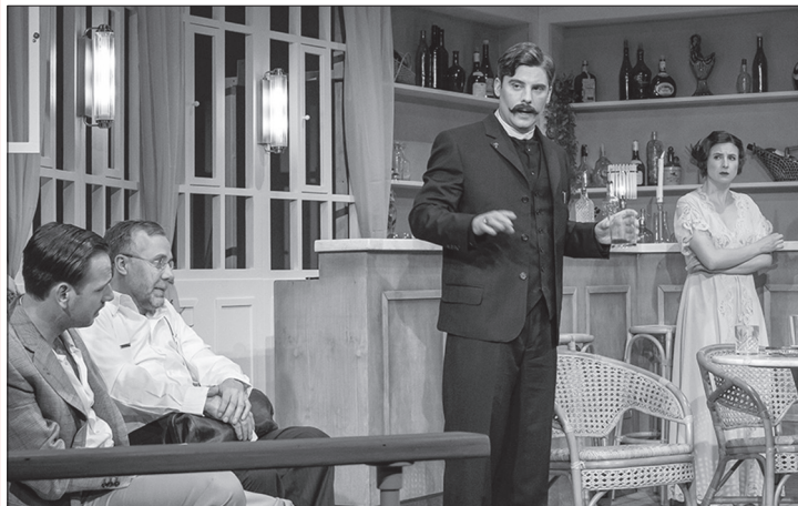
Die Landesbühne spielt heute den Agatha Christie Kriminalklassiker „Tod auf dem Nil“

Norderney – Ein Nil-Dampfer, eine Hochzeitsreise und ein Mord: Mit Agatha Christies Kriminalklassiker „Tod auf dem Nil“ gastiert die Landesbühne Niedersachsen Nord am heutigen Dienstagabend im Kurtheater.