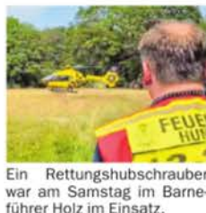
Ein Rettungshubschrauber war am Samstag im Barneführer Holz im Einsatz.

HATTEN – Aufwendige Rettungsaktion in der Gemeinde Hatten im Landkreis Oldenburg: Ein Mann ist am Samstagmittag gegen 13.30 Uhr im Barneführer Holz circa fünf Meter den steilen Uferhang der Hunte hinabgestürzt. Nach einer Mitteilung der Feuerwehr war der 35-Jährige aus Weyhe von einer Seilschaukel, die an einem Baum befestigt war, gefallen. Das Seil war offenbar gerissen. Die Feuerwehren Sandkrug, Wardenburg und Hüntlosen sowie die Wasserrettung der