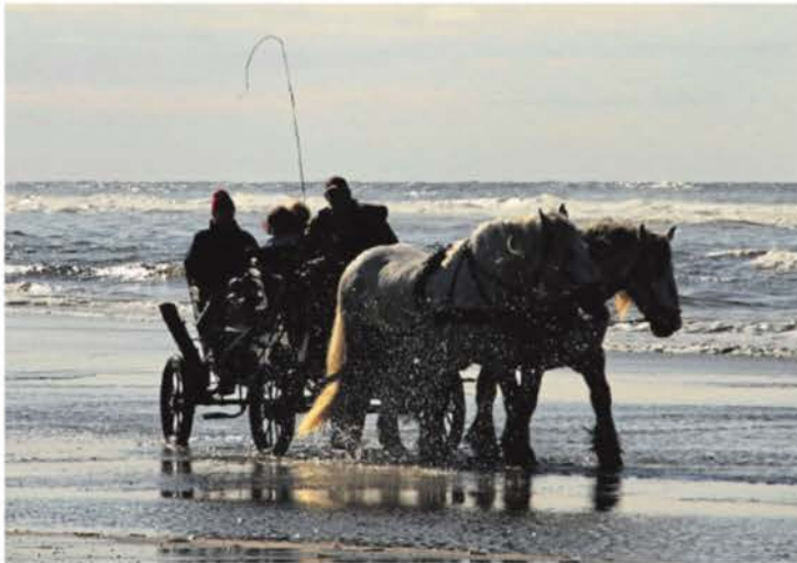
Kraftvoll: Ostfriesland ist stark touristisch geprägt. Das stärkt die Wirtschaft in der Region. Unser Archivfoto zeigt eine Pferdekutsche am Strand von Juist.

Und auch die durchschnittlichen Ausgaben der Gäste sind laut Studie höher als drei Jahre zuvor: Übernachtungsgäste gaben 105 Euro pro Tag aus, Tagesgäste 29,70 Euro. Da die Stadt Wilhelmshaven 2025 aus der Tourismusgesellschaft ausgeschieden ist, vergleiche die aktuelle Studie die Ergebnisse von 2022 in einer um