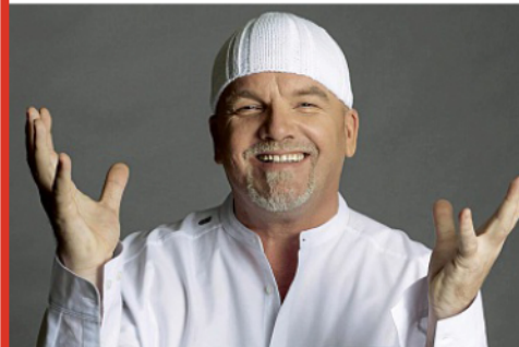
DJ Ötzi sorgt mit seinen Hits für den Summertime-Abschluss auf Norderney.

Die Termine in diesem Sommer sind: 20. bis 24. Juli, 27. bis 31. Juli und 3. bis 7. August. Die Anmeldung für die Ferienschwimmkurse erfolgt online unter norderney.de/ferienschwimmkurse .