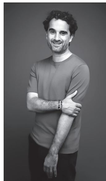
Schauspieler Oliver Wnuk liest aus seinem Buch.

Er liest aus seinem neuen Buch „Besser wird's nicht“, das Ende Januar erschienen ist. Der Titel ist dabei kein Stoßseufzer, sondern eine Einladung: Besser als dieser Moment wird es nicht, wenn wir ihn nicht nutzen. Mit Humor und Selbstironie blickt Wnuk auf die kleinen und großen Zumutungen des Lebens und auf ein Ego, das immer mehr will, auf Freundschaften, gesellschaftliche Erwartungen, Sein und Schein sowie auf die Frage, wie man in einer von Künstlicher Intelligenz geprägten Zukunft Mensch bleibt. Leicht, klug und ohne Pathos verbindet er Lesung, Schauspiel und Erzählung zu ei-