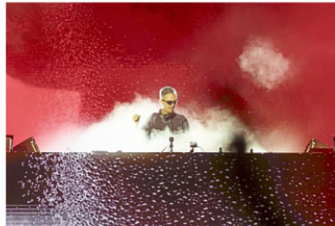
Star-DJ Robin Schul eröffnet das Summertime@Norderney in diesem Jahr.