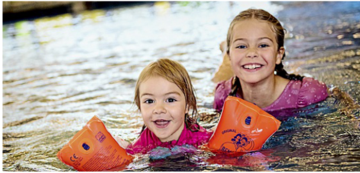
Auch die Jüngsten können sich bei der Ferienschwimmschule früh ans Wasser gewöhnen und das Schwimmen lernen.

Gerade auf einer Insel wie Norderney ist sicheres Schwimmen von besonderer Bedeutung. Strömungen, Wind, Wellen und wechselnde Bedingungen können selbst in Ufernähe schnell zur Herausforderung werden. Umso wichtiger ist es,