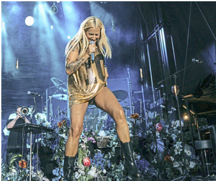
Sarah Connor tritt zwei Mal auf Norderney auf. Für das Konzert am 1. August gibt es bei uns noch Tickets zu gewinnen.

Den Summertime-Auftakt macht am 29. Juli Robin Schulz, einer der erfolgreichsten deutschen DJs weltweit. Mit seinem Mix aus House, Electro und Pop hat er Milliarden Streams gesammelt und internationale Bühnen bespielt. Songs wie „Sugar“, „Waves“ oder „Prayer in C“ haben ihn zu einem der prägenden Künstler der vergangenen Jahre gemacht. Sein Auftritt auf Norderney markiert den Start