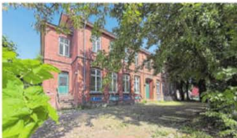
Noch sieht es ziemlich verwildert auf dem Gelände der ehemaligen Grundschule aus. Das soll sich bald ändern.

Ziel der Kommune sei es, die vorhandene Gebäudesubstanz möglichst nachhal-