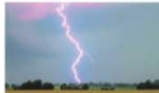
Heftige Gewitter zogen in der Nacht von Samstag zu Sonntag über die gesamte Region Ostfrieslands.

■ Im Auricher Ortsteil Middels traf am frühen Sonntagmorgen gegen 5 Uhr ein Blitz ein Haus in der Westerlooer Straße. Der Dachstuhl