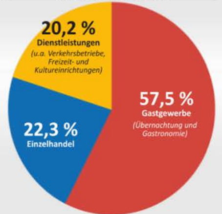
Nicht nur das Gastgewerbe profitiert – auch der Einzelhandel und viele Dienstleister in Ostfriesland profitieren von Urlaubern und Tagesgästen. BILD: JULIANE BÖCKERMANN

So verteilt sich der touristische Gesamtumsatz von 3,4 Mrd. Euro in 2025