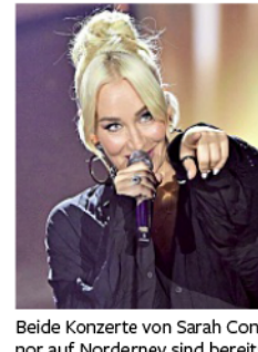
Beide Konzerte von Sarah Connor auf Norderney sind bereits restlos ausverkauft.