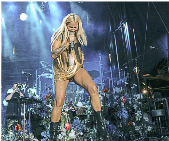
Sarah Connor tritt zwei Mal auf Norderney auf. Für das Konzert am 1. August gibt es bei uns noch Tickets zu gewinnen.

Den Summertime-Auftakt macht am 29. Juli Robin Schul, einer der erfolgreichsten deutschen DJs weltweit. Mit seinem Mix aus House, Electro und Pop hat er Milliarden Streams gesammelt und internationale Bühnen bespielt. Songs wie „Sugar“, „Waves“ oder „Prayer