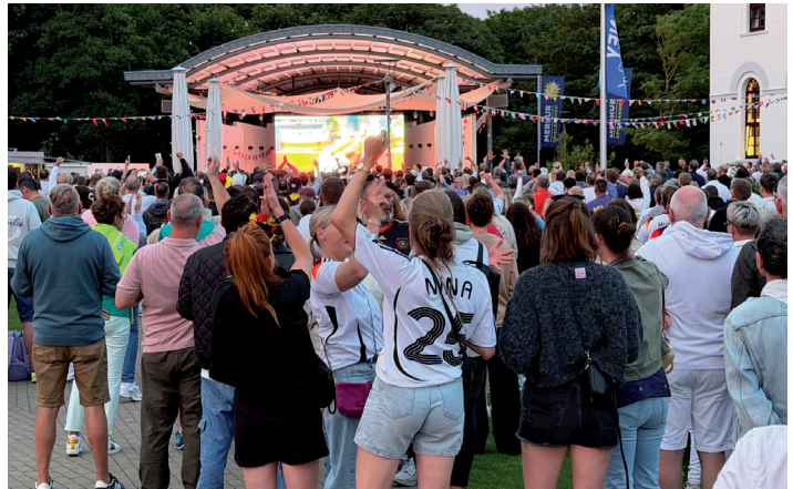
Im Vorrundenspiel gegen die Elfenbeinküste wurde auf dem Kurplatz bis weit nach Mitternacht mitgefiebert.

schwarz-rot-goldenes Wohnzimmer unter freiem Himmel verwandelt – mit vielen, vielen Fußballfreunden, die gemeinsam mitfeiern, mitzittern und vielleicht wieder jubeln dürfen.