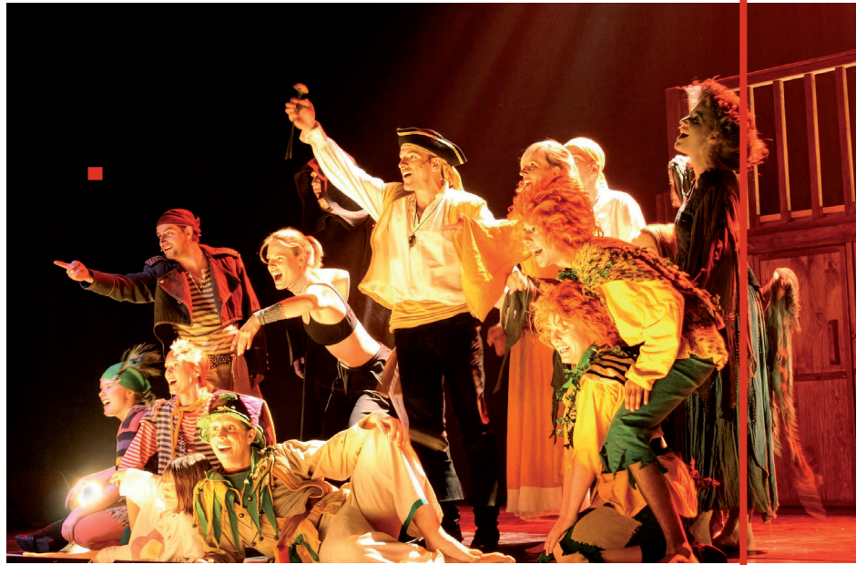
Aufführung von Käpt'n Hakenhand als Musical auf der Insel.