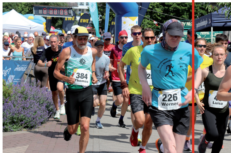
Start zur Norderneyetappe des EWE-Nordseelaufs 2026 vor dem Conversationshaus.

tungen an der Küste zählt: sportlich anspruchsvoll, landschaftlich beeindruckend und getragen von einer starken Botschaft.