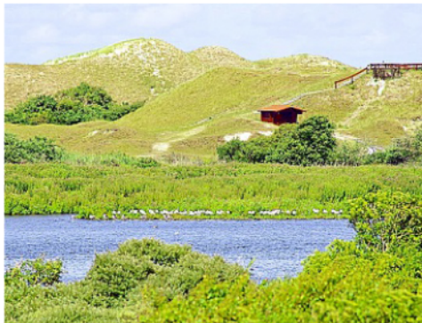
Nach Meinung des Nabu bedarf es eines Managing-Konzeptes für den Südstrandpolder.