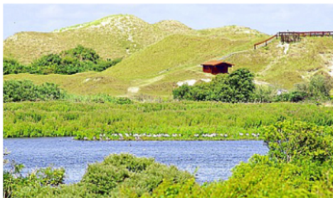
Nach Meinung des Nabu bedarf es eines Managing-Konzeptes für den Südstrandpolder.

Nabu fordert bessere Brutbedingungen für seltene Arten