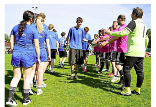
Team Schüler gegen Team Lehrer - am Ende zählt der gemeinsame Spaß am Duell.

Die Entscheidung fiel im Neunmeterschießen. Je drei Schützen traten an, doch nach der ersten Runde herrschte weiter Gleichstand. Erst im finalen Show-down entschied das Glück: Ein Lehrerschuss strich haarscharf am Pfosten vorbei. Am Ende jubelten die Absolventen über ein 7:6.