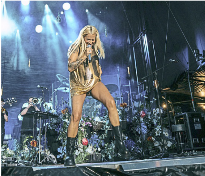
Die Konzerte von Sarah Connor sind Pop-Power pur.

Es gibt weitere Karten für ausverkauftes Sarah-Connor-Konzert auf Norderney