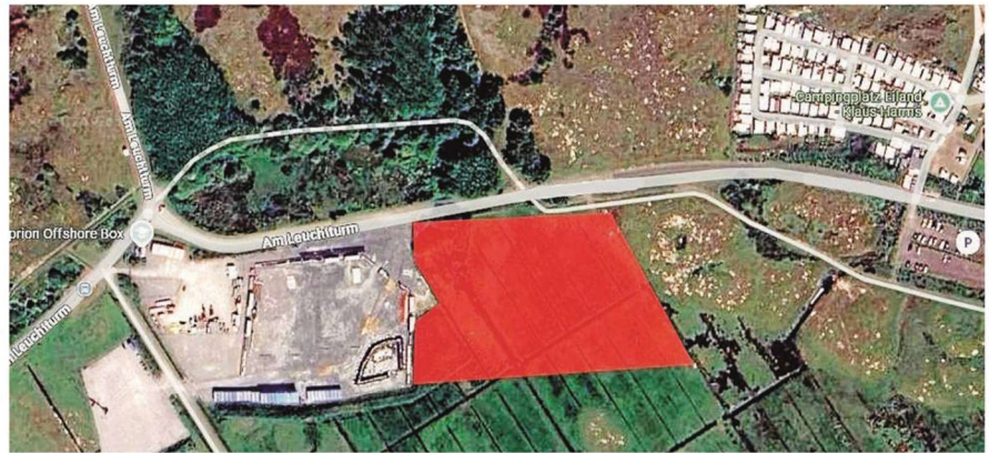
Ostlich der bereits von Amprion genutzten Fläche soll ab Montag die Erweiterung entstehen (im Bild rot gekennzeichnet).

Insgesamt können rund 1000 Quadratmeter der bereits bestehenden Schotterfläche weiter genutzt werden. Neu hinzu kommen nun 14000 Quadratmeter Schotterfläche sowie rund 1000 Quadratmeter Lager-