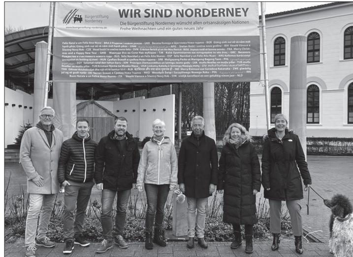
Mit dem Banner der Nationen heißt die Bürgerstiftung erneut Neubürger willkommen.

Norderney/ape – Norderneys Bürgerstiftung war über die Festtage und den Jahreswechsel erneut aktiv. Mit einem Banner am Kurplatz spricht sich die Bürgerstiftung für ein solidarisches Miteinander der auf der Insel lebenden und arbeitenden Menschen aus 62 Nationen aus. Das Transparent trägt die Aufschrift: „Die Bürgerstiftung Norderney wünscht allen ortsansässigen Nationen frohe Weihnachten und ein gutes neues Jahr“. Die Weihnachts- und Neujahrswünsche sind zudem übersetzt in die jeweiligen Landessprachen. Mit der Aktion möchte die Stiftung ein Zeichen für eine Willkommenskultur gegenüber allen aus anderen Ländern und Kulturkreisen