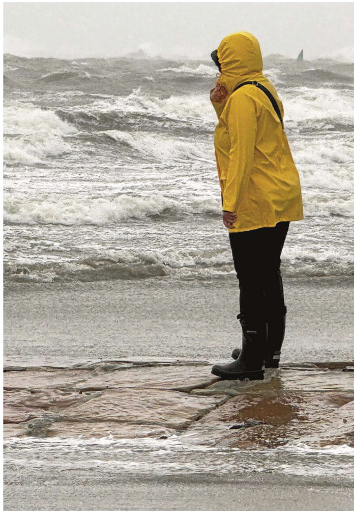
Es sind die ruhigsten Wochen des Jahres auf Norderney. Das merkt man nicht zuletzt an der kurzen Liste der Veranstaltungen. Was immer funktioniert, ist das Meer, die Ebbe und die Flut..

8.15 Uhr 10-Minuten-An- dacht in der evangelischen Inselkirche.