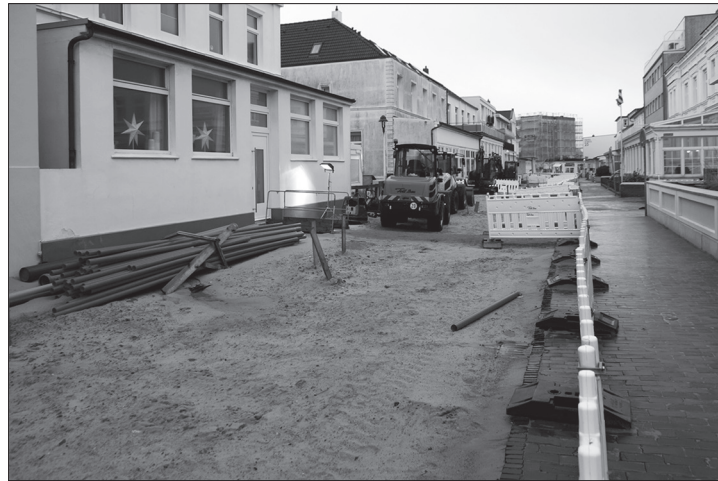
In der Moltkestraße liegen die Arbeiten für die Straßenerneuerung im Zeitplan. Bald können die Fußgänger auf die westliche Straßenseite wechseln.