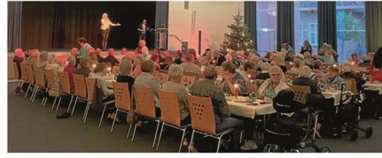
Kaffee, Kuchen und Unterhaltungsprogramm.

NORDERNEY Mehr als 100 Seniorinnen und Senioren wurden in der vergangenen Woche zur traditionellen „Olljoarsfier“ der Awo-Norderney in die Aula der KGS geladen. Bürgermeister Frank Ulrichs nutzte die Gelegenheit, um auf die medizinische Versorgungssituation bezüglich des