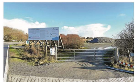
Die jetzige Einfahrt des Amprion-Geländes.

Die beiden geplanten Offshore-Netzanbindungssysteme BalWin1 und BalWin2 werden sowohl auf der Land- als auch auf der See-seite größtenteils parallel zueinander installiert. Beide Projekte können jeweils eine