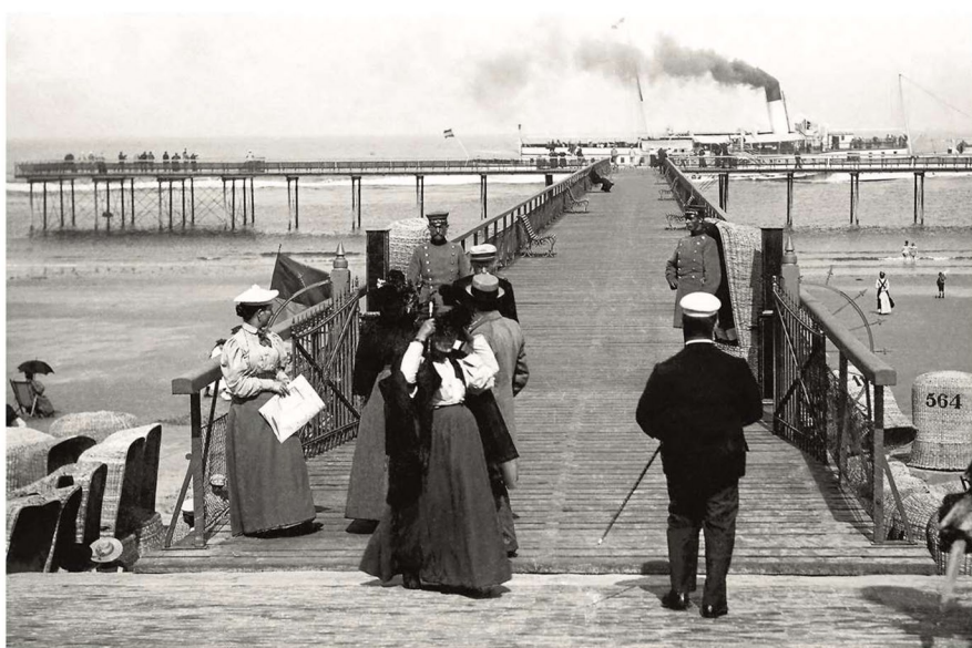
Zugang zum Seesteg um 1900 von der heutigen Milchbar aus betrachtet.

Aber so ganz vergessen ist der historische Name Seesteg auf Norderney dann doch noch nicht. Das Restaurant „Seesteg“ hat den alten Namen wieder mit einem exklusiven Menüangebot zu neuem Glanz aufpoliert. Wenn auch nicht mehr auf dem Meer