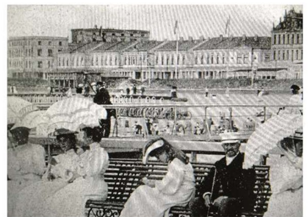
Panoramablick mit Meeresperspektive.