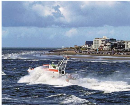
Die „Eugen“ im Sturm vorm Weststrand.

Für diese neue Serie von NDR und Radio Bremen hat sich die Deutsche Gesell-schaft zur Rettung Schiffbrü-chiger (DGzRS) erstmals monatlang auf ihren ge-fährlichen Einsätzen mit der Kamera begleiten lassen. Über einen Zeitraum von 16 Monaten fahren Videojour-nalisten immer wieder mit den Seenotrettern hinaus. Außerdem dokumentieren fest installierte Kameras (GoPros) auf den Rettungs-