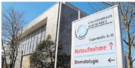
Das Krankenhaus auf Norderney ist insolvent.

Ein bitterer Tag für die Inselgemeinschaft, die auf das Krankenhaus als zentrale Einrichtung angewiesen ist. Inzwischen ist nicht nur die Einrichtung in der Lippestraße in finanzielle Schieflage geraten, sondern auch das Medizinische Versorgungszentrum (MVZ) Norderney.