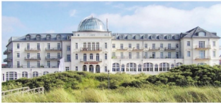
Dieser Anblick gehört zu Juist dazu. Doch unter Denkmal steht das Strandhotel Kurhaus nicht mehr.

Das Kur- und Strandhotel wurde 1983 erstmals als Bau- und Denkmal anerkannt und am