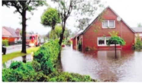
Land unter in der Ringstraße: Immer wieder steht dieses Gebäude in der Moordorfer Ringstraße nach Starkregen unter Wasser.

Die Vertreter der Ostfriesischen Landschaftlichen Brandkasse klärten über Versi-