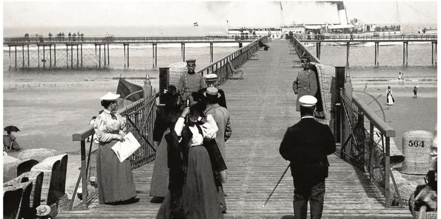
Zugang zum Seesteg um 1900 von der heutigen Milchbar aus betrachtet.

Das Magazin, Moderne Welt berichtete 1896: „Prächtig ist der im vorigen Jahre neu erbaute Seesteg, der fast 200 Meter weit hin-