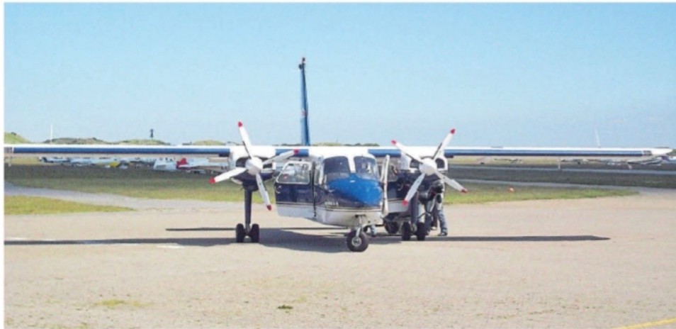
Kein Flugverkehr mehr zwischen Norddeich und Juist ab 1. März: die FLN-Inselflieger

Im Gegenteil: Neben den Kutschen seien in den letzten