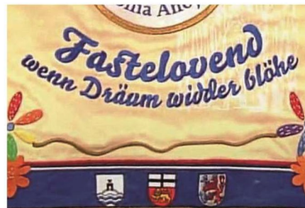
Norderneyer Wappen auf der Fahne des Trifoliums.

In der Regel wird das Trifolium im Spätsommer vorgestellt, damit es zur Sessi-