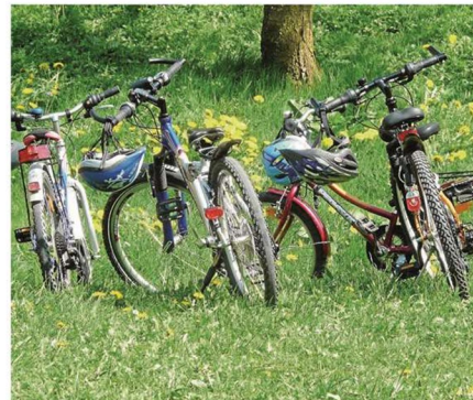
Auch für die „Marschverpflegung“ in den Pausen der Fahrradtouren ist gesorgt.

In den Leistungen zu dieser Tour, die pro Person im Doppelzimmer 278 Euro