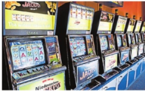
Ein Blick in den Automatenaal der Spielbank Bad Zwischenahn. Dieser Standort scheint gesichert.

Das Verwaltungsgericht Hannover hatte in der Vorwoche eine Klage der SNG zur Vergabe der Spielbanklizenz zurückgewiesen. Die SNG, eine Tochtergesellschaft der Casinos Austria International GmbH (CAI), war bei der Neuausschreibung im November 2023 unterlegen und wehrte sich vor Gericht gegen den Verlust der Lizenz. Sie machte