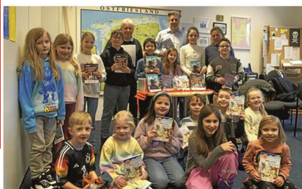
Buchübergabe durch die Rotarier in der Grundschule.

AL hat sich seit seiner Einführung bestens bewährt und ist auf Dauer angelegt. Die Tatsache, dass deutschlandweit über 250 000 Kinder mit Lesen lernen, Leben lernen seit 2003 gefördert werden konnten, spricht für den Erfolg des Rotary-Projekts.