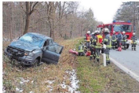
Der Wagen kam nach rechts von der Fahrbahn ab.

■ Bei einem Verkehrsunfall auf der B437 bei Ruttel sind zwei Personen leicht verletzt worden. Wie die Polizei-Pressestelle und die Pressestelle der Freiwilligen Feuerwehr Neuenburg am Sonntag mitteilen, ereignete sich der Vorfall am Samstagmorgen, als ein 46 Jahre alter Mann aus Großefehn mit seinem Pick-up Ford des Typs Ranger aus Neuenburg kommend in Richtung Wittmund unterwegs war. Auf Höhe des Muni-