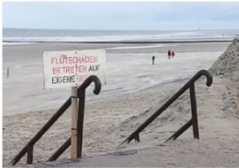
Ein Schild am Strand der Nordseeinsel Wangerooge weist auf Flutschäden hin: Laut Ländern sind Milliardeninvestitionen in den Schutz der Küste nötig.

Unterstützung bekommt Goldschmidt von seinem niedersächsischen Amtskollegen. „Die Klimakrise und die damit verbundene Meeresspiegelan-