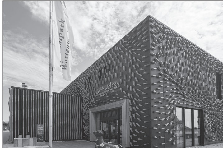
Das Watt-Welten-Besucherzentrum am Hafen erhält in diesem Jahr eine neue Ausstellung mit einem Investitionsvolumen von zwei Millionen Euro.

(ape) – Von außen wirkt das Watt-Welten-Besucherzentrum noch unverändert, doch hinter den Kulissen laufen die Vorbereitungen für eine neue Ausstellung. Zehn Jahre nach seiner Eröffnung steht das Haus am Hafen vor einer grundlegenden Neugestaltung.