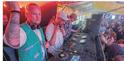
Die DJ-Formation der Insel, The Ney Guys, sorgen bei der Opening-Party für Stimmung.

Die Beliebtheit und die Qualität des White Sands Festivals überzeugt auch die Sponsoren des Festivals. So weitet das Online-Reiseportal Urlaubsguru sein Sponsorship