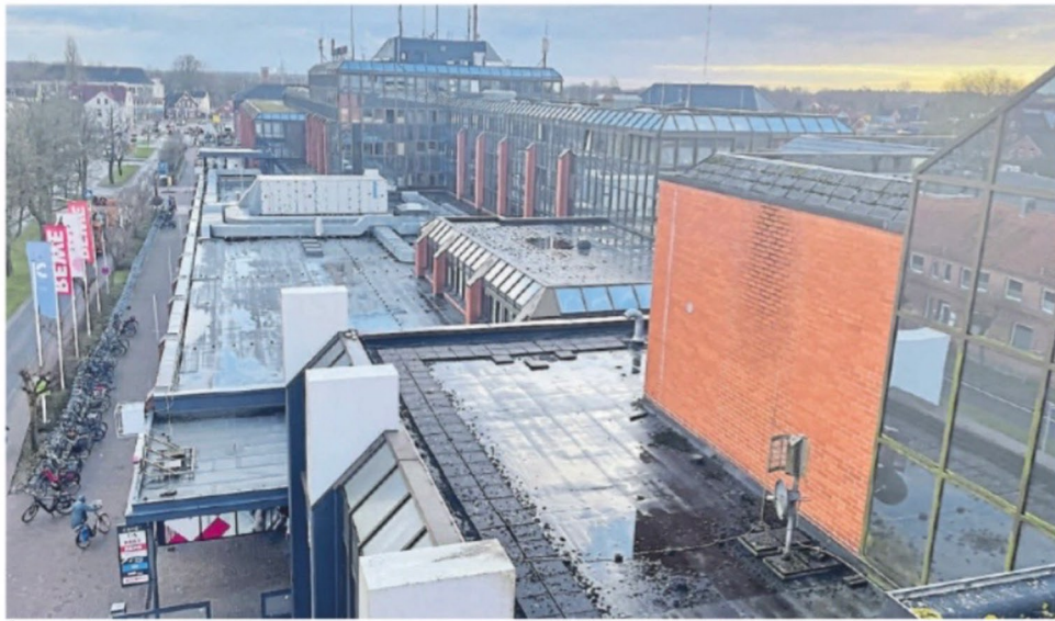
Über den Dächern von Aurich: Das Dach des Kreishauses soll mit PV-Anlagen bestückt werden.

Die ursprüngliche Firma war mit dem Bau von sechs Photovoltaik-Anlagen auf verschiedenen Gebäuden beauftragt, darunter die Förderschule Moordorf und das Kreishaus Aurich. Mittlerweile wurde der Bauabschnitt neu ausgeschrieben und an die Firma HEPS-Haustechnik aus Hage vergeben. Schoolmann