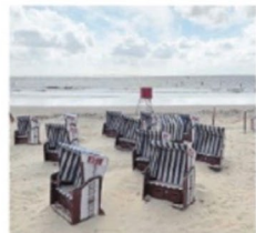
Ein unbesetzter Wachturm der DLRG am Weststrand Norderneys.

In anderen Urlaubsdestinationen und Städten sieht die Lage da ganz anders aus. So konnten in den vergangenen