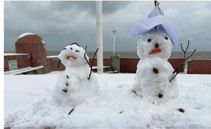
Wenigstens diese beiden freuen sich über den Schnee.

meers kann man vom „Wattensteg“ besonders gut beobachten. Treffpunkt ist in der Surferbucht.