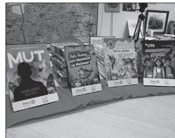
Von Fiete Hering und Koala-Crew bis zum Buch über Gruppenzwang und Mobbing: Für jede Jahrgangsstufe ist etwas dabei.

Kinder im Lehrerzimmer vor. Um damit auch im Unterricht arbeiten zu können, erhielt die Schule zusätzlich aufbereitetes Lehrmaterial. Lehrerin Maren Opitz-Kobarg dankte den Rotariern im Namen der Grundschule für die Spende und berichtete, die Bücherauswahl habe in den vergangenen Jahren viel Spaß gemacht.