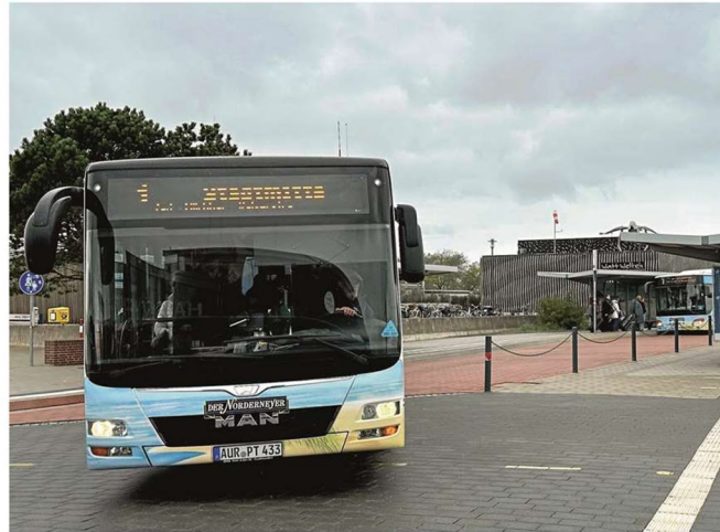
Die Zukunft der insularen Busbetriebe steht in den Sternen.

Ganz im Gegenteil: Die Linienplanung spielt für die Entschädigungen so gut wie keine Rolle. „Wenn es uns nur um das Geld ginge, könnten wir jetzt auch den Fahrplan ausdünnen oder unsere Linie 3 beispielsweise