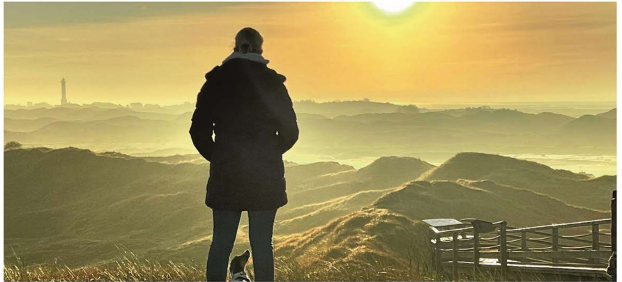
Auch das gehört zu Thalasso: „Einmal runterkommen und die gute Luft inhalieren“.

Aufgrund ihrer Herkunft aus den Küstenregionen haben die Teilnehmerinnen und Teilnehmer bereits Berührungspunkte mit der Thalasso-Therapie. Die meisten erhoffen sich von dem Seminar eine Vertiefung und wissenschaftliche Untermauerung ihrer täglichen Arbeit. Viele werden von ihren Arbeitgebern zum Seminar entsendet – als Fortbildung und auch zum Zwecke weiterer Prädikatisierung.