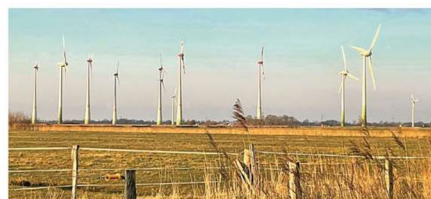
Windanlagen bei Groß Midlum: Sie rücken näher an die Wohnbebauung.

Zwischen Westerhusen, Groß Midlum und Hinte will die WEA Hinte Projekt GmbH & Co. KG aus Moor- merland acht bestehende Anlagen abbauen und durch sieben größere ersetzen; das Verfahren nennt sich „Repowering“. Die Interessensge-