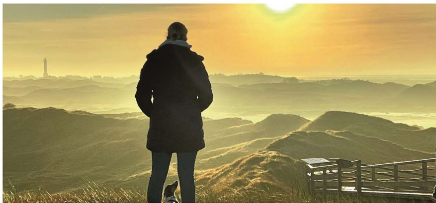
Auch das gehört zu Thalasso: „Einmal runterkommen und die gute Luft inhalieren“.

Aufgrund ihrer Herkunft aus den Küstenregionen haben die Teilnehmerinnen und Teilnehmer bereits Berührungspunkte mit der Thalasso-Therapie. Die meisten erhoffen sich von dem Seminar eine Vertiefung und wissenschaftliche Untermauerung ihrer täglichen Arbeit. Viele werden von ihren Arbeitgebern zum Seminar entsendet – als Fortbildung und auch zum Zwecke weiterer Prädikatisierung.