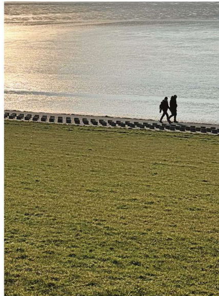
Der Deich an der Leyhöörn: Eine Erhöhung um bis zu drei Meter steht im Raum.

Küstenschutz ist eine Gemeinschaftsaufgabe von Bund und Ländern. Die Investitionskosten verteilen sich zu 70 Prozent auf den Bund und zu 30 Prozent auf das jeweilige Land. Niedersachsen investierte zusammen mit den Bundesmitteln im vergangenen Jahr eine Rekordsumme von rund 80 Mil-