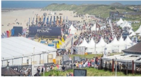
Das White Sands Festival lockt über Pfingsten zahlreiche Besucher auf die Insel. In diesem Jahr ist die Ticketnachfrage besonders hoch.

NORDERNEY – Über Pfingsten verwandelt sich die Nordseeinsel Norderney über Pfingsten wieder in ein Paradies für Fun- und Trendsportbegeisterte, Partyfreunde und Genussmenschen. Das White Sands Festival findet vom 6. bis zum 8. Juni am Nordstrand statt. Die Vorbereitungen laufen bereits auf Hochtouren.