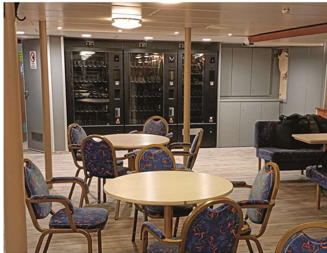
Die neu verbauten Automaten im unteren Salon der „Frisia II“ an der Stelle, wo bisher ein Verkaufstresen stand.