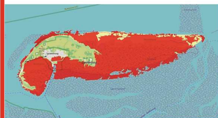
Weite Teile Spiekeroogs würden im Meer versinken.

Die Karte des HCU ist für Internetuser abrufbar unter sealerverse.hcu-hamburg.de .