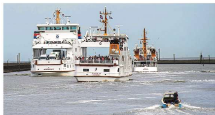
Neue Wege in der Bordrestauration bei der Frisia. Archivbild