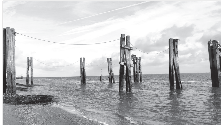
Das Unternehmen Niedersachsen-Ports plant für die Schwerlastrampe am Weststrand die Erneuerung der Anlegedalben und einen Ausbau der Zubringerstraße.

(dol) – Der Hafentreiber Niedersachsen-Ports (NPorts) hat im Rahmen seiner kürzlichen Jahresmedienkonferenz Arbeiten an der Norderneyer Schwerlastrampe angekündigt, die seit dem vergangenen Jahr von der Reederei „Meine Fähre“ als Anleger genutzt wird. Demnach steht die Erneuerung der dortigen Anlegedalben an. „Die neuen Dalben werden so gestaltet sein, dass sie den Anforderungen der Nutzer am besten dienen“, heißt es dazu auf Nachfrage aus der NPorts-Pressestelle: „Das stimmen wir mit unseren Kunden ab.“ Der Hafentreiber wird darüber hinaus die Zufahrtstraße zu der Rampe um eine Abbiegespur erweitern, um einen möglichen Verkehrsstau an der Straße Zum Fähranleger zu vermeiden.