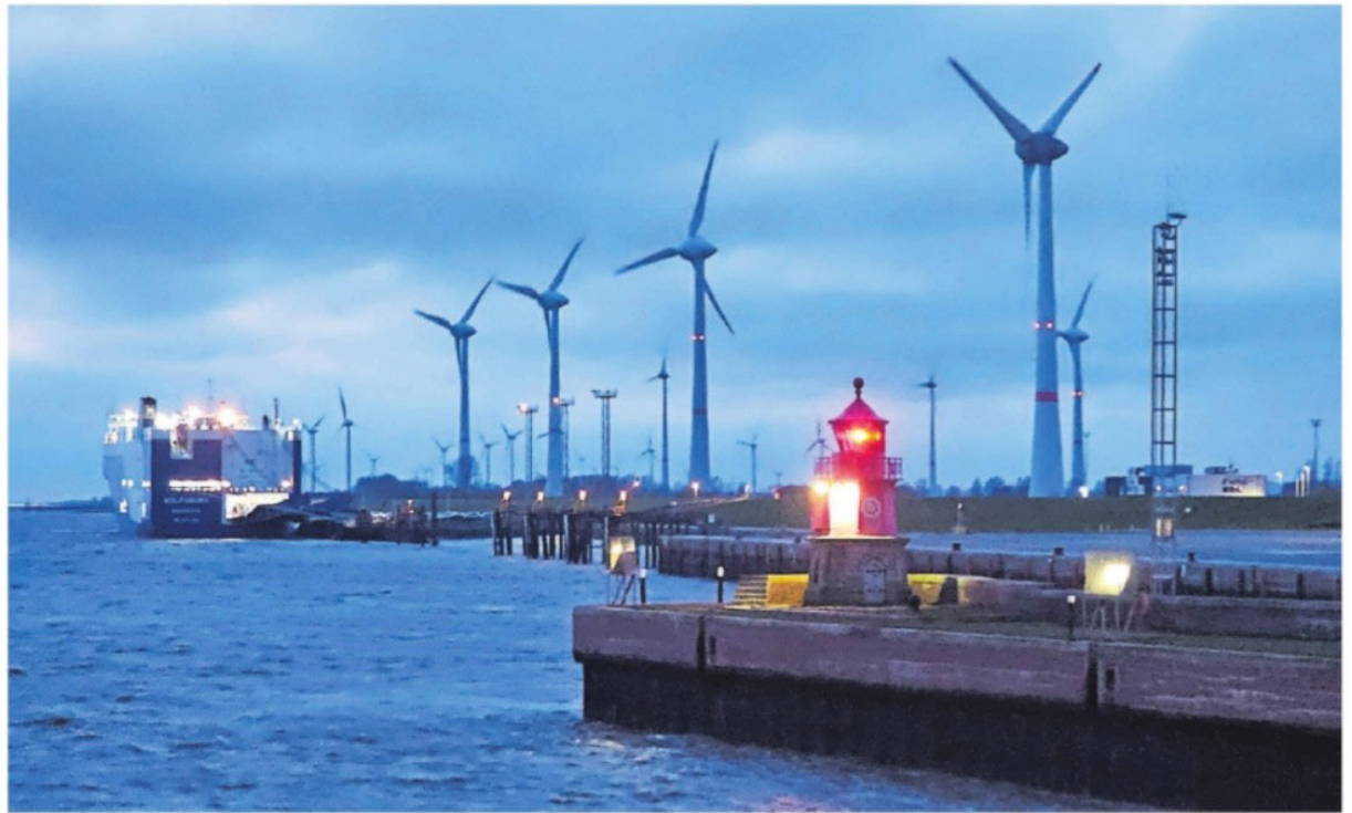
In Emden entsteht ab dem Sommer zwischen Emskai (vorne an der Westmole) und Emspier (hinten am Autotransporter) für 70 Millionen Euro ein neuer Großschiffs-Liegeplatz. Für die weitere Erschließung des Emsufers entlang des Wybelsumer Polders entwickelt NPorts gerade Ideen.

„Unsere Häfen sind das Rückgrat der deutschen Energieversorgung“, betont Olaf Lies deren Bedeutung vor allem mit Blick auf die derzeitige Regierungsbildung in Berlin. „Und ihr weiterer Ausbau damit eine nationale Aufgabe.“ Die Hafennwirtschaft weist schon seit Jahren darauf hin, dass die Häfen für den per Gesetz vorgesehenen Ausbau der erneuerbaren Energien dringend erweitert werden müssen. „Für das Erreichen dieser Ausbauziele fehlt es in Europa in den Häfen an Umschlagkapazität für Windenergie“, heißt es beim Zentralverband der deutschen Seehafenbetriebe (ZDS). „Das gilt