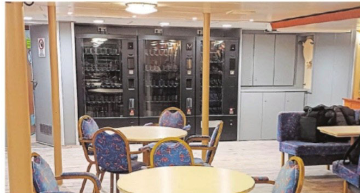
Statt des Bedienungsstresens gibt es auf drei Frisia-Schiffen nun Automaten.

Die Automaten wurden vorerst auf den beiden Juist und Norderney bedienenden Schiffen „Frisia II“ und „Frisia VI“ sowie auf der reinen Norderney-Fähre „Frisia I“ jeweils im unteren Salon installiert. Die beiden ausschließlich nach Norderney eingesetzten Doppelendfähren „Frisia III“ und „Frisia IV“ haben aufgrund veränderter Bauvorschriften keinen