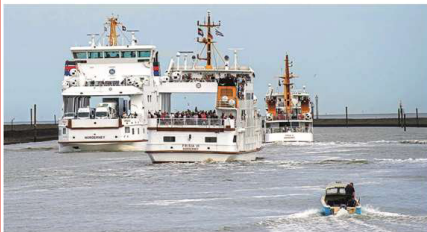
Neue Wege in der Bordrestauration bei der Frisia. Archivbild

III“ und „Frisia IV“ haben aufgrund veränderter Bauvorschriften keinen unteren Salon mehr. Die Automaten sollen demnächst in Betrieb genommen werden, allerdings betonte Anke Wolff, dass im oberen Salon der drei umgerüsteten Fährschiffe weiterhin Gastronomie mit Service am Tisch stattfinden wird. Lediglich auf den beiden kleineren Ausflugsschiffen/Juist-Fähren „Frisia X“ und „Frisia XI“ gibt seit einiger Zeit nur noch ein Warenangebot über Automaten. erd