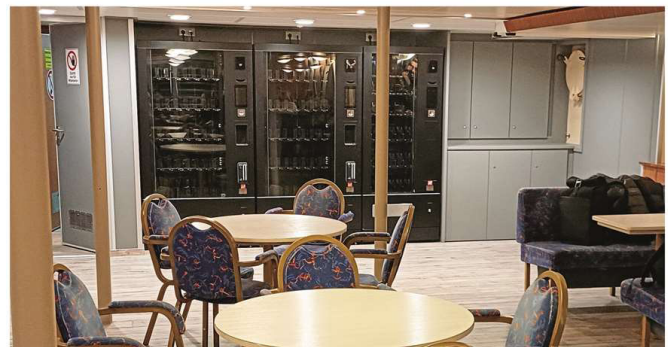
Die neu verbauten Automaten im unteren Salon der „Frisia II“ an der Stelle, wo bisher ein Verkaufstresen stand.

Die beiden ausschließlich nach Norderney eingesetzten