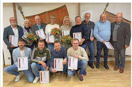
25 Mitglieder sind seit 25 Jahren beim TuS-Norderney.

liegt daran, dass wir beim TuS den Eintrag in das Golden Buch der Stadt wegen des Gewinns des ‚Paddels‘ einfach nicht toppen können“. Sportwart Christoph Volkamer übernahm darauf das Wort und verkündete als Mannschaft des Jahres für den Aufstieg in die Ostfriesenlandliga die 1. Fußball-Herrenmannschaft. Der zweite Teil des Berichts über die Jahresversammlung des TuS Norderney mit weiteren Ehrungen, der Finanzsituation und den Plänen für das laufende Jahr steht morgen im KURIER.