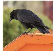
Krähe am MKW.

wer die 200 Euro zur Identifizierung der Täter bekommen sollte, die der Verein ausgesetzt hatte.