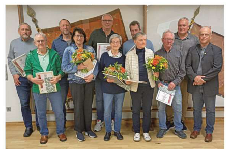
14 Mitglieder halten dem TuS seit 50 Jahren die Treue.