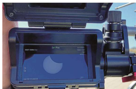
Gut im Sucher der TV-Kamera zu erkennen: Der Mond bedeckt etwa ein Drittel der Sonnenfläche. Das Fernsehteam vom ZDF verteilte Spezialbrillen an Interessierte.

Für einen besonderen medialen Rahmen sorgte ein Kamerateam des ZDF, das eigens vom ZDF-Studio aus Hannover dafür angereist war. Das ZDF-Team fing das Ereignis ein und führte Interviews mit interessierten Zuschauern vor Ort. Zudem verteilte das Team spezielle Sonnenfinsternisbrillen an die Besucher, um eine sichere Beobachtung der Sonne zu ermöglichen.